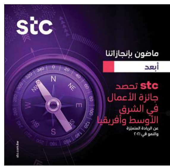
جائزة الأعمال في الشرق الأوسط وأفريقيا

الخدمات وتحقيق التطوير المستمر لشبكته عن طريق تنفيذ، بشكل منفرد على مستوى المنطقة، للإصدار الأحدث من شبكات الجيل الخامس، وتعزيزه بشبكة موازنة عن طريق الطيف 3G Sub والذي بدوره يعمل على إثراء تجربة المستخدم من حيث التغطية والسرعة