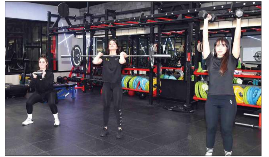
ممارسة بعض التمارين بدرجات أوزان متعددة

برنامج محدد ومتابعة من قبل مدربات متمكنات سيعود ذلك على المرأة الرياضية بالفوائد الكثيرة لتعيش حياة سليمة وصحية.