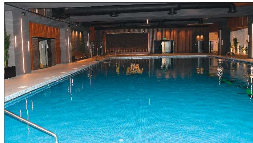
السباحة من أفضل الرياضات للصحة ورشاقة الجسم