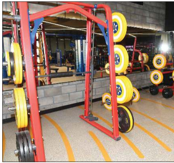
أجهزة ومعدات رياضية لجميع الألعاب