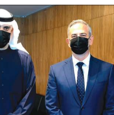
الشيخ د.مشمعل الجابر والمدير العام لشركة روش دياجنوستيكس الكويت د.فاسيليس باكويانيس