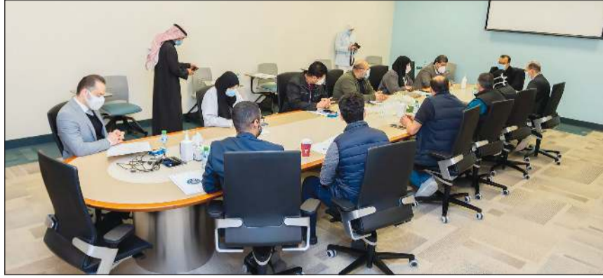
جانب من اجتماع وزير الصحة د.خالد السعيد مع الكوادر الطبية في مستشفى جابر

■ الرفاعي: الحرس الوطني يسعى إلى أن يكون جهاز الإسناد الأول الداعم لوزارات ومؤسسات الدولة وفي مقدمتها «الصحة» مع الحرص على تحديث بنيته التحتية لمواجهة المنغبرات ■ مستشفى جابر: 5 أجنحة في قسم الباطنية لحالات «كوفيد-19» وتجهيز جناح آخر وبدء تجهيز جناح جديد.. ووحدة عناية مركزة مخصصة لحالات الأطفال