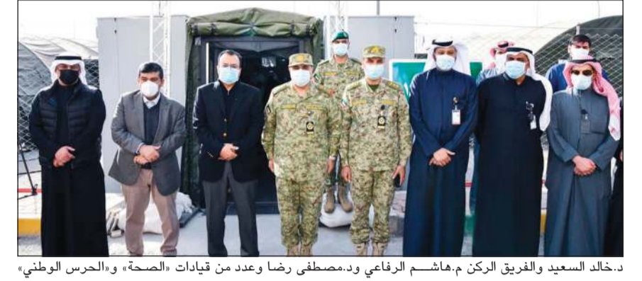
د.خالد السعيد والفريق الركن م.هاشم الرفاعي ود.مصطفى رضا وعدد من قيادات «الصحة» و«الحرس الوطني» خلال افتتاح المستشفى الميداني

وجود جناحين للأطفال، وتجهيز جناح ثالث ليصل العدد إلى 3 أجنحة، فضلاً عن وحدة عناية مركزة مخصصة لحالات الأطفال. وأقام مسؤولو المستشفى بالوقت هناك تماشياً في الوقت الحالي بين أعداد الطواقم الطبية والتمريضية وبين نسبة الإشغال، كما أوضحوا خطة المستشفى حال ازدياد نسبة الإشغال، وألية التعامل معها وفق الخطة البديلة. هذا، وقد اجتمع الوزير مع عدد من الكوادر الصحية والإدارية والطبية والفنية العاملة في المستشفى، وعدد من الكوادر العاملة و فرق «كوفيد-19» في المستشفى الأخرى، للتحديد على استمرارية التنسيق والعمل كفريق واحد. واستمع الوزير إلى احتياجاتهم خلال الفترة المقبلة، مبدياً حرصه على تدعيم المستشفى بمزيد من الكفاءات الطبية في مختلف التخصصات، مثنياً جهود جميع الكوادر الطبية وفنّيهم في أداء رسالتهم السامية، والمستوى المتميز في تقديم الخدمة الطبية وفق أفضل معايير الجودة.