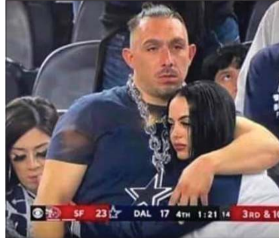
اللحظة التي كشفت خيانة المشجع الحزين

تلقي أحد مناصري فريق «دالاس كاوبويز» الأميركي ضربة مزدوجة تمثلت في خسارة فريقه مباراة كرة القدم الأميركية في البطولة السنوية «سوبر بول»، التي تزامنت مع اكتشاف خطيبته أنه يخونها على الهواء مباشرة، وذلك خلال مشاهدتها المباراة على شاشة التلفزيون. وتضاعفت أزمة خسارة فريق «دالاس كاوبويز»، وما ترتب على ذلك من حزن المشجع لخسارة فريقه، عندما لفت هذا الحزن انتباه مخرج البث التلفزيوني في اللحظة التي كان يواسي فيها صديقته، حيث سارع المصور لتسلط الضوء على المشجع المتأثر بالهزيمة، لكن اتضح لاحقا أن الفتاة التي كان يواسيها ليست خطيبته، بل شابة يخونها معها. وبعد أن تلقت خطيبته المشجع الصدمة تحدثت المخدوعة عن القصة على وسائل التواصل الاجتماعي، حيث كالت الاتهامات