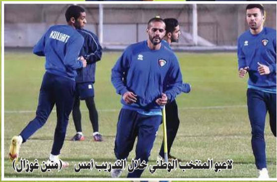
لاعب المنتخب الوطني خلال التدريب أمس