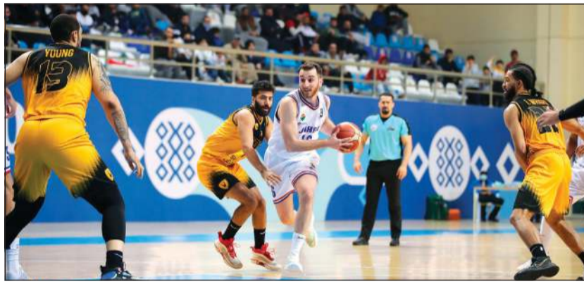
جانب من مواجهة القادسية والجهراء