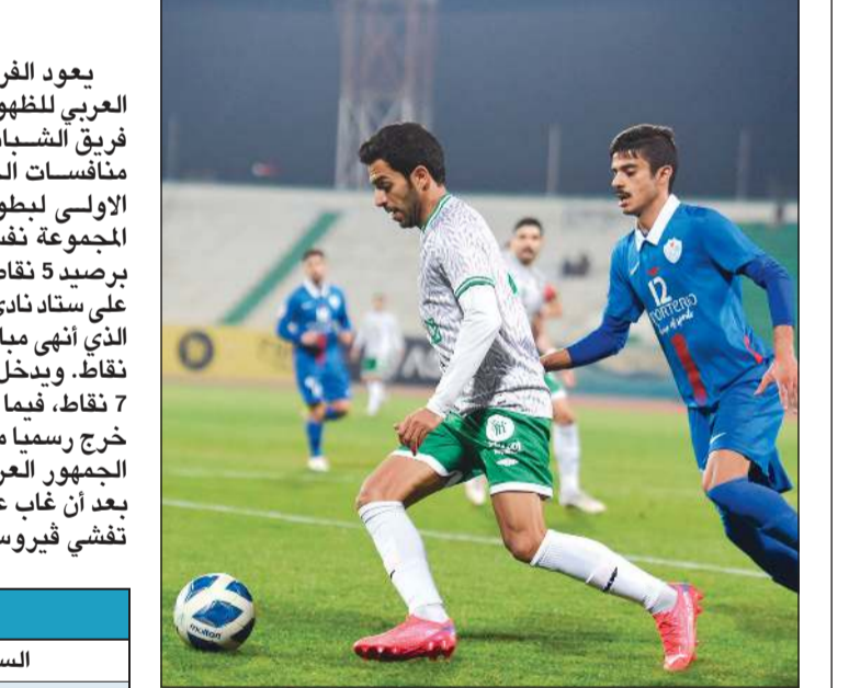
العربي يسعى لتجاوز الشباب والتقدم بكأس الاتحاد

يعود الفريق الأول لكرة القدم بالنادي العربي للظهور أمام جماهيره عندما يلتقي فريق الشباب على ستاد ناصر في إطار منافسات الجولة الخامسة من المجموعة الأولى لبطولة كأس الاتحاد. ولحساب المجموعة نفسها يلعب اليوم أيضًا برقان برصيد 5 نقاط مع الساحل بلا رصيد، وذلك على ستاد نادي التضامن. ويقف فريق كاظمة الذي أنهى مبارياته على قائمة الانتظار بـ 7 نقاط. ويدخل الأخضر المباراة وفي جعبته 7 نقاط، فيما يمتلك الشباب 3 نقاط، وقد خرج رسمياً من حسابات المنافسة، ويتربع الجمهور العربي والظهور الأول لفريقه بعد أن غاب عن المشهد الرياضي بسبب تفشي فيروس كورونا بين صفوفه، ولقي