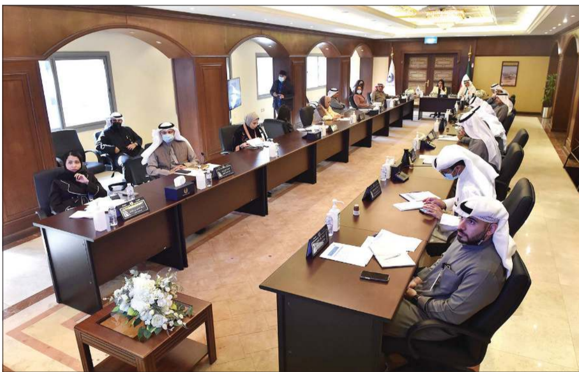
صورة أرشيفية لممثلي الهيئة العامة لمكافحة الفساد «نزاهة» مع منظمات المجتمع المدني خلال الاجتماع التسيقي الثالث