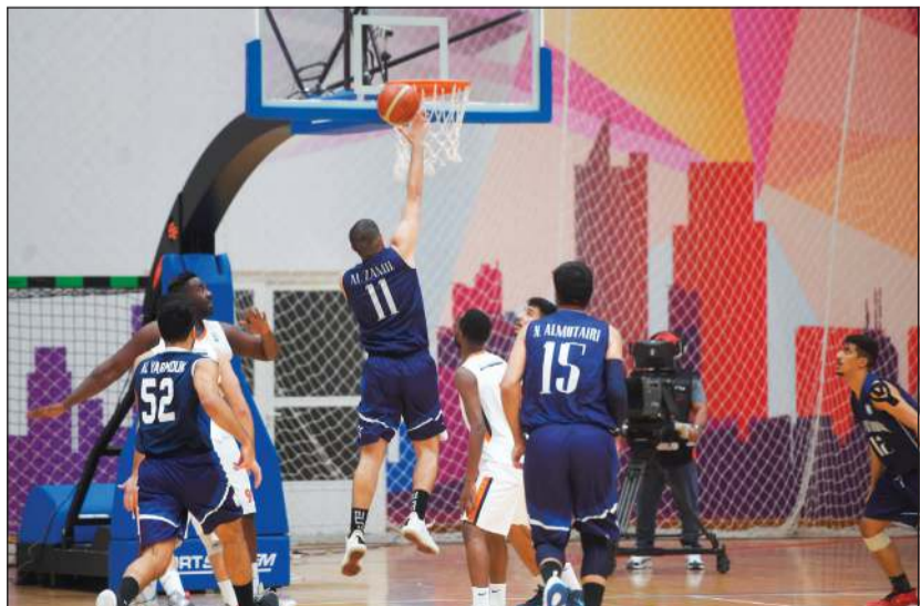
اليرموك يسعى للتأهل إلى الدوري الممتاز لكرة السلة الموسم المقبل (محمد هاشم)

المركز الأخير لتعزیز حظوظه في المنافسة على المركز الأول المؤهل مباشرة إلى الدوري الممتاز، أو الظفر بالمركز الثاني على أقل تقدير للإبقاء على أمل اللعب في «الممتاز» شريطة تجاوز صاحب المركز الخامس في مواجهة تجمعهما تقام بنهاية الموسم بنظام «البلاي أوف» بأفضلية الفائز في مباراتين من ثلاث متاح، فيما ستكون مباراة الشباب ومنتخب الشباب (تحت 19 سنة) في الـ 5:30 مساءً، فيما تجمع المواجهة الثانية بين الساحل واليرموك في الـ 7:30 مساءً. ويأمل اليرموك بقيادة مربيه الوطني خالد القلاف في تجاوز الساحل صاحب