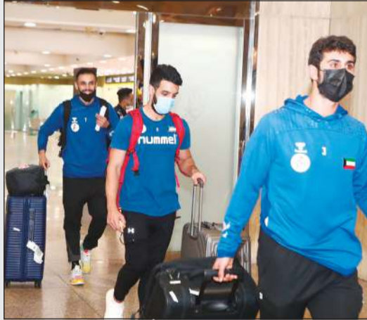
جانب من وصول لاعبي الأزرق إلى السعودية