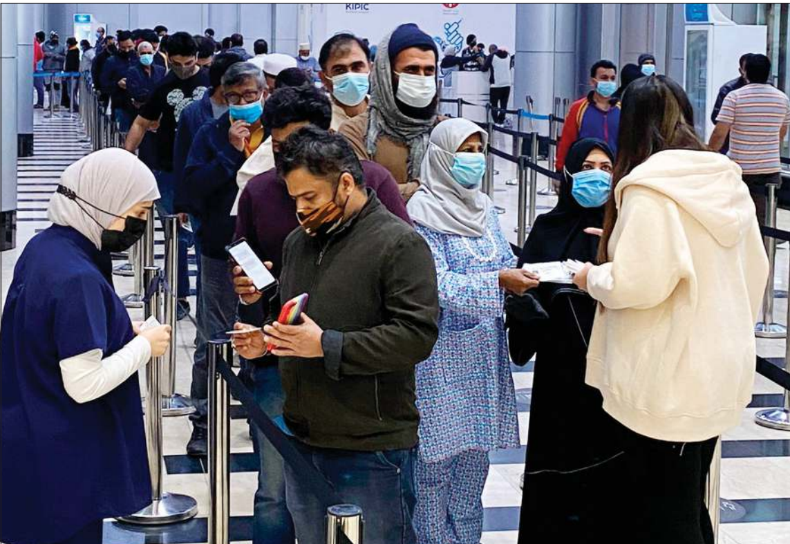
تجديد الدعوة إلى استكمال الجرعة التنشيطية