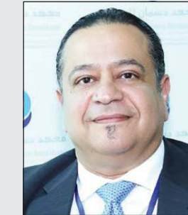
البروفيسور د. فهد الملا

المؤكد فعليا هو أن هذا الفيروس يتحور بسرعة كبيرة لا توجد في الفيروسات الأخرى وهو الاندماج بين الفيروسات الأخرى من كورونا. وأوضح أن كل ما يحدث من تحورات حالية للفيروس قادمة بنشره منذ عام في بحث بمجلة علمية عالمية أشاروا خلاله إلى أن كورونا فيروس تكمن خطورته في كونه قادرا على الاندماج في متحورات أخرى.