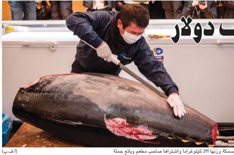
السمكة وزنها 211 كيلوغراما واشترامها صاحب مطعم وبيائع جملة

طوكيو - أ.ف.ب: بيعت سمكة تونة تزن 211 كيلوغراما بـ 146 ألف دولار خلال مزاد رأس السمكة التقليدي في طوكيو الأربعاء، لحساب طاه حائز نجمة في دليل ميشلان، لكن هذا السعر لا يزال بعيدا عن الرقم القياسي المسجل سنة 2019 خصوصا بسبب تبعات الأزمة الصحية. وقد تراجع المبلغ المدفوع في أول مزاد خلال السنة في سوق تويوسو للأسماك في العاصمة اليابانية، للسنة الثالثة على التوالي بسبب تراجع الطلب المستمر بفعل الجائحة. فقد كان مبلغ 16,9 مليون ين ياباني (146 ألف دولار) الذي