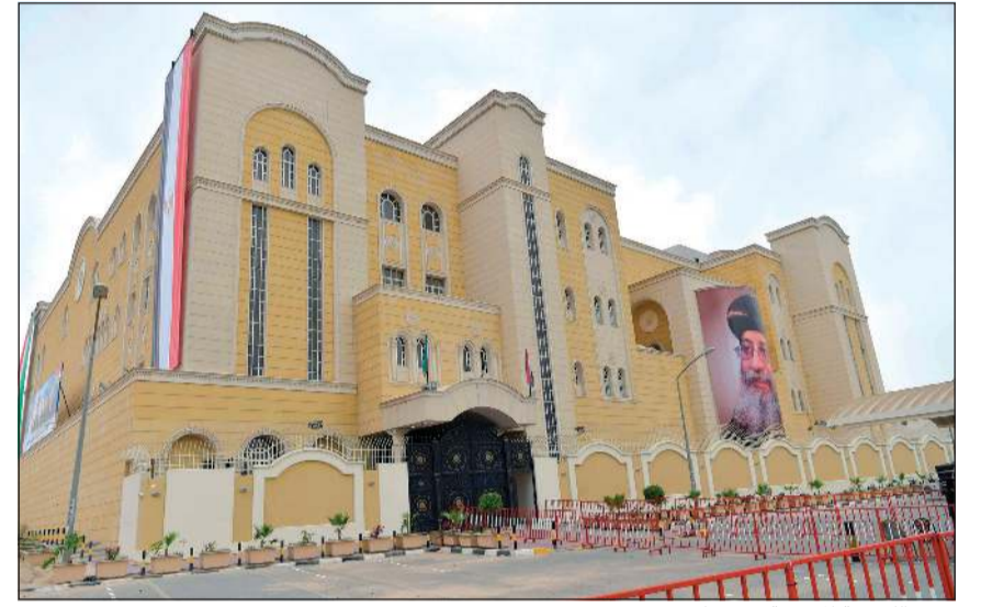
مبنى الكنيسة المصرية في حولي