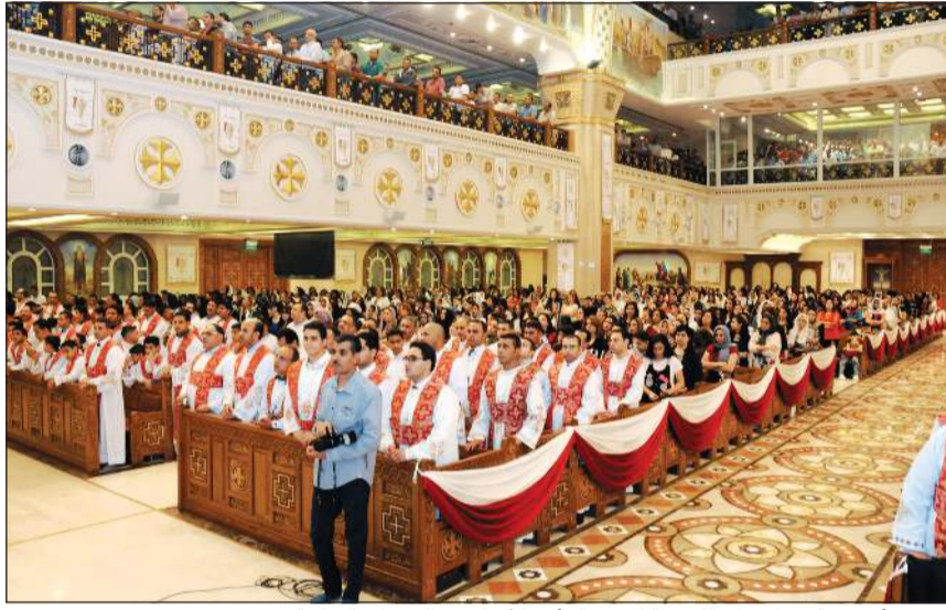
صورة أرشيفية من احتفال الكنيسة المصرية بأحد الأعياد في السنوات السابقة