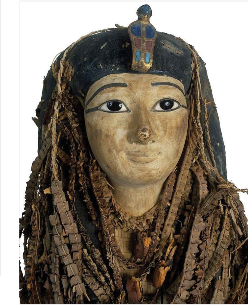
المومياء اكتشفت مزينة باكلايل من الأزهار وقناع وجه رائع مرصع بأحجار كريمة