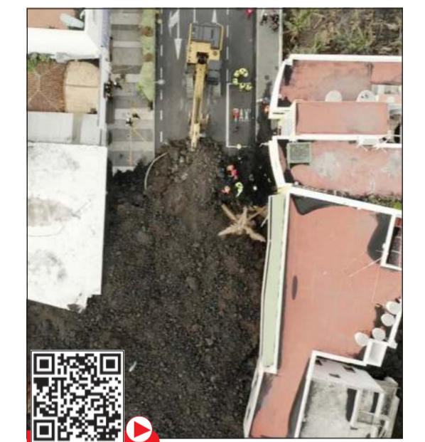
جرافة ترفع الحمم من أحد الشوارع

أ.ف.ب: بدأت فرق الطوارئ في جزيرة لا بالما الإسبانية في إزالة الحمم المتجمدة التي خلفها بركان كومبري فييخا. وتجمعت الحمم البركانية في أنحاء الجزيرة بعد فترة طويلة، حيث عطلت الحركة في الشوارع وغيرها. وكانت إسبانيا أعلنت رسمياً الانتهاء ثوران بركان بعد نشاط استمر أكثر من ثلاثة أشهر أحدث خلالها أضراراً جسيمة.