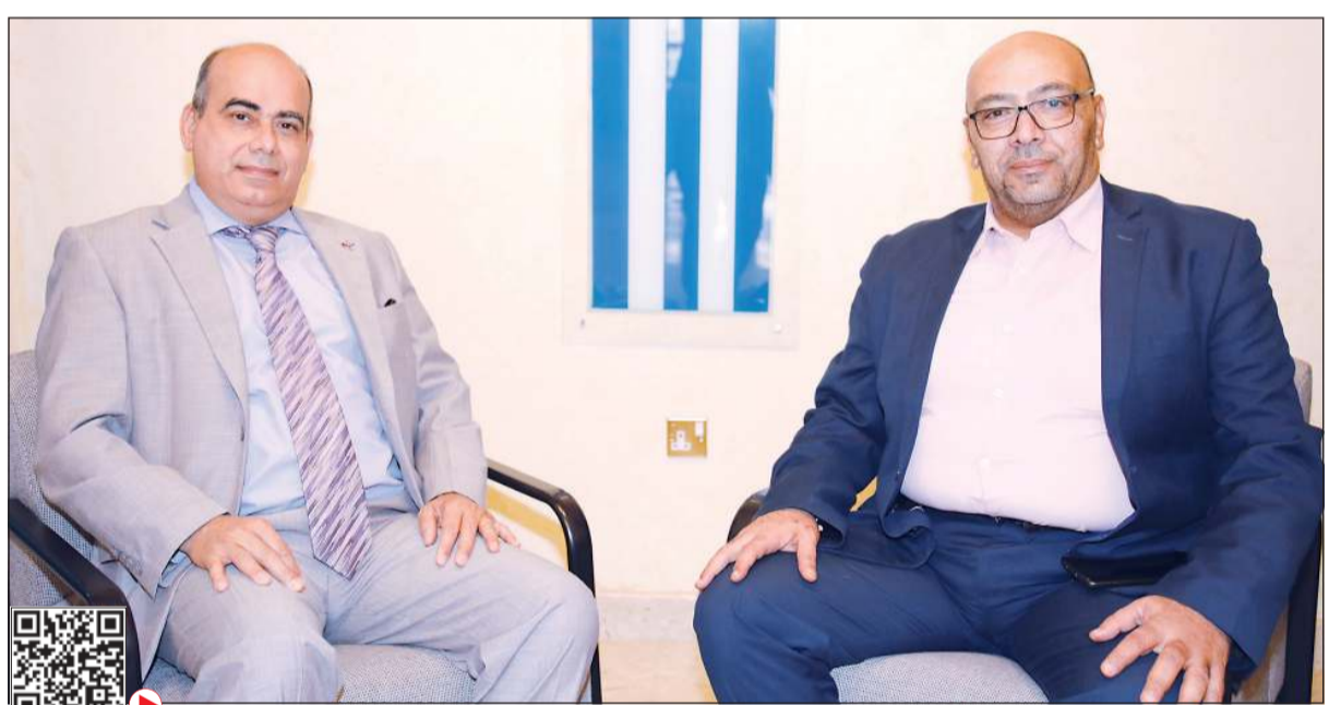
السفير الكوبي هوسيلويز نورويغا والزميل أسامة دياب خلال اللقاء

● المجال الطبي والرعاية الصحية من أبرز مجالات التعاون بين البلدين الصديقين، ولقد تعاوننا مع الكويت بشكل فعال خلال الظروف الصعبة