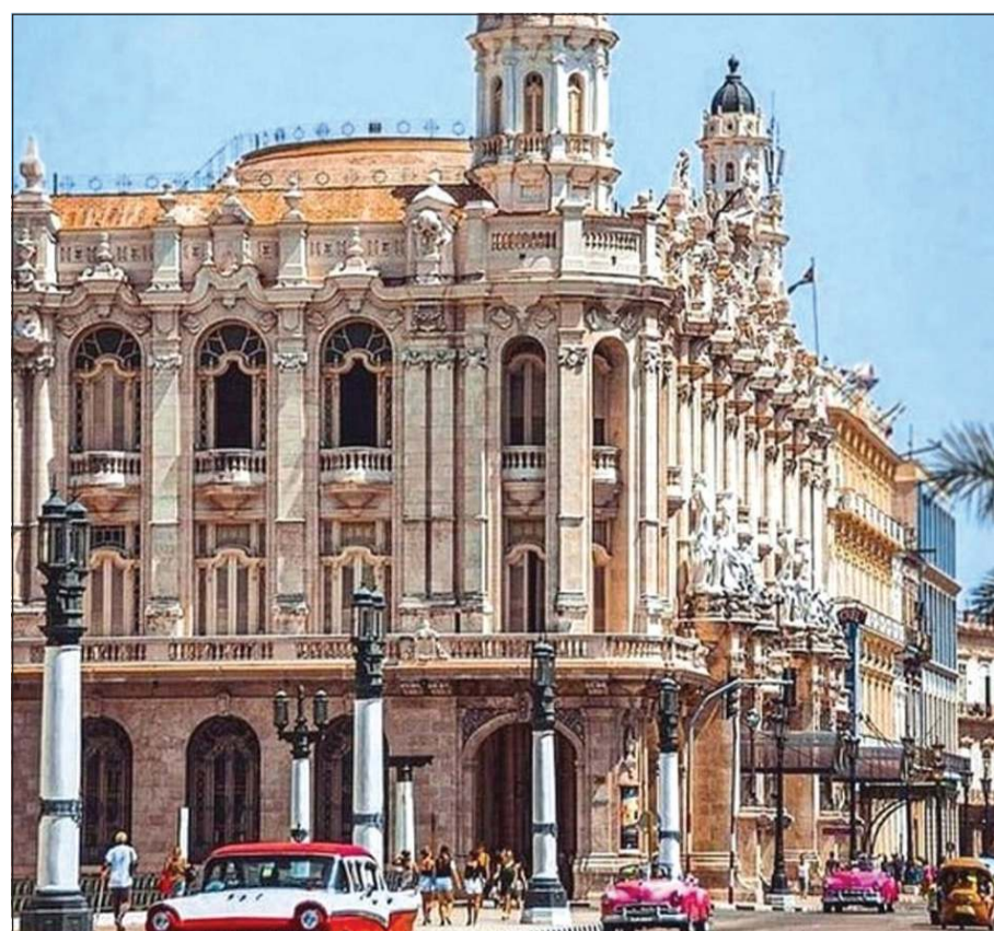
البنائات الكوبية ذات طراز معماري فريد

أشار السفير هوسيلويز نورويغا إلى أن بلاده كوبا فازت بجائزة أفضل وجهة ثقافية في الكاربي عن 2021. نظراً إلى الإمكانيات السياحية الهائلة التي تتمتع بها والتنوع الثقافي والحضاري الذي يميزها.