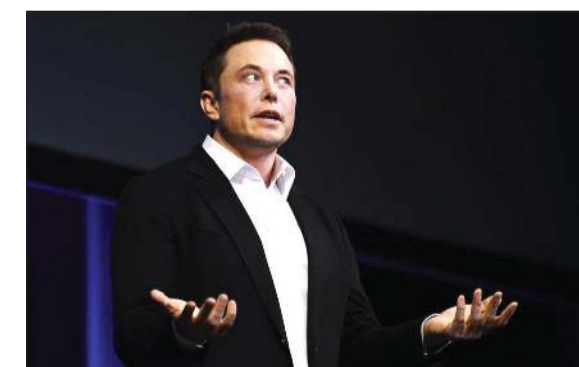
إيلون ماسك سيدفع ضرائب «أكثر من أي أميركي في التاريخ»

الضرائب المزور حتى يدفع شخصية العام الضرائب فعلياً ويتوقف عن استخدام ثرواته للحكومة الفيدرالية بنحو 11 مليار دولار ضرائب هذا العام. على السيناتورة، بالقول إنه