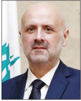
وزير الداخلية اللبناني بسام مولوي