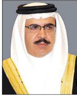
وزير الداخلية البحريني راشد بن عبدالله

وكالات: أكد الفريق أول الشيخ راشد بن عبدالله آل خليفة وزير الداخلية البحريني، أن قيام عناصر مخالفة للقانون ببت وترويج ادعاءات مغرضة ضد البحرين عبر لبنان أمر يبسه للبحرين وكذلك لبنان، موضحاً أن هذه العناصر تجمعها علاقات تعاون وتواصل مع جهات خارجية تسعى للبحرين وتقوم بالتدخل في شؤونها الداخلية.