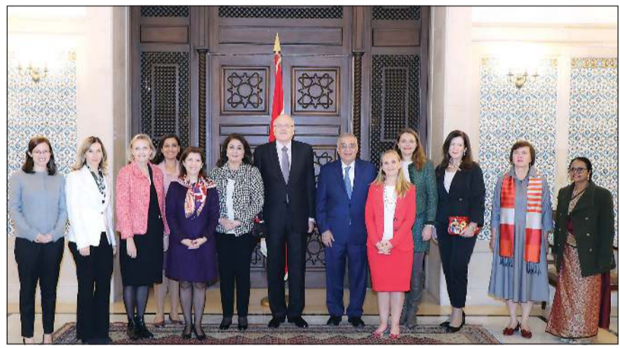
رئيس الوزراء نجيب ميقاتي وقيادته خلال حفل غداء تكريمياً للسفيرات المعتمدات لعدد من الدول (محمود الطويل)