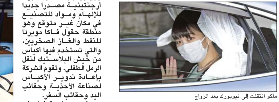
ماكو انتقلت إلى نيويورك بعد الزواج

طوكيو - رويترز: انتقد ولي عهد اليابان وسائل الإعلام اسس الثلاثاء بسبب مغالطات و«أمور فظيعة» في تغطيتها لخطبة ابنته الأميرة السابعة ماكو التي تخلت عن مكانتها في العائلة الإمبراطورية الشهر الماضي للزواج من رجل من عامة الشعب. وأزجات ماكو (30 عاماً) زوجها من كي كومورو لنحو ثلاث سنوات بسبب معارضة نتجت عن قضية مالية تتعلق بوالدته. وخلال هذه الفترة عانت ماكو من اضطراب ما بعد الصدمة حسب تشخيص حالتها. وتخلت ماكو، بموجب القانون الياباني، عن وضعها في العائلة الإمبراطورية لدى زواجها بتقديم أوراق بذلك لمتب محلي وانتقلت للعيش في نيويورك هذا الشهر.