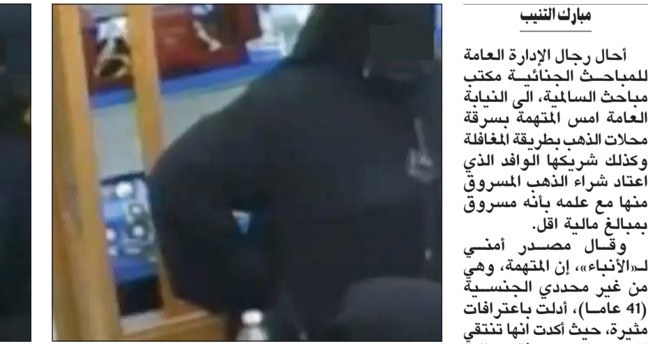
لقطة من فيديو للمتهمة خلال تنفيذ إحدى سرقاتها

كاميرات المراقبة وكانت تحرص على ارتداء النقاب او تضع كمامة سوداء، مشيرة الى انها كانت تقوم بجولات استكشافية قبل السرقة بيوم وتحدد المحل الذي ستسرقه. وأقرت المتهمة بسرقة عدة محلات في مناطق الماركية وحولي والفحجيل والفروانية، كما اكدت أن الوافد الذي كان يشترى منها الذهب يعرف انها تتحصل على الذهب بسبل غير مشروعة رغم أنه نفى هذه المزاعم خلال التحقيق معه. وكان رجال مباحث السالمية، وبعد تحريات استمرت لفترة من الوقت، استطاعوا توقيف المتهمة كما تمكنوا من ضبط شريكها (40 عاماً) حيث يعمل في أحد محلات بيع المجوهرات في منطقة السالمية.