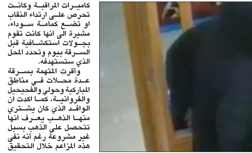
.. ولدى وضع يدها لسرقة الذهب

كاميرات المراقبة وكانت تحرص على ارتداء النقاب او تضع كمامة سوداء، مشيرة الى انها كانت تقوم بجولات استكشافية قبل السرقة بيوم وتحدد المحل الذي ستسرقه. وأقرت المتهمة بسرقة عدة محلات في مناطق الماركية وحولي والفحجيل والفروانية، كما اكدت أن الوافد الذي كان يشترى منها الذهب يعرف انها تتحصل على الذهب بسبل غير مشروعة رغم أنه نفى هذه المزاعم خلال التحقيق معه. وكان رجال مباحث السالمية، وبعد تحريات استمرت لفترة من الوقت، استطاعوا توقيف المتهمة كما تمكنوا من ضبط شريكها (40 عاماً) حيث يعمل في أحد محلات بيع المجوهرات في منطقة السالمية.