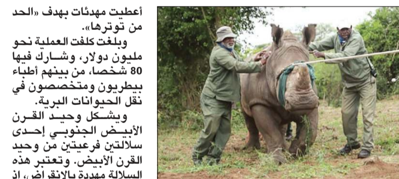
الحيوانات نقلت إلى رواندا

محمية أكافيرا الوطني - أ.ف.ب: نقل ثلاثون من حيوانات وحيد القرن الأبيض الجنوبي إلى رواندا من جنوب أفريقيا، على ما أعلن مسؤولون في محمية أكافيرا الوطنية شرق رواندا أول من أمس، واصفين عملية النقل هذه بأنها «أكبر من نوعها في التاريخ» لهذه الحيوانات المهددة بالانقراض. واستلزم نقل هذه الحيوانات، التي يصل وزن كل منها إلى طنين، يومين، وتم جزئياً بطائرة «بوينغ 747» في رحلة بلغت مسافتها 3400 كيلومتر. وقال المدير الإداري لمنظمة «أفريكان باركس» غير