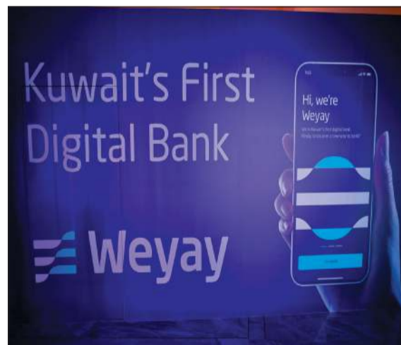
«وياي» أول بنك رقمي في الكويت