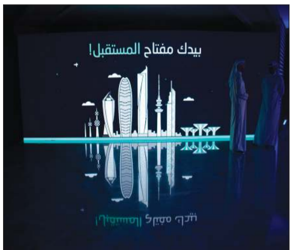
بيدك مفتاح المستقبل

أطلق بنك الكويت الوطني أول بنك رقمي في الكويت «وياي» الذي تم تطويره بإياد كويتية شابة، وذلك لتلبية احتياجات وتطلعات الشباب الكويتي. وتم إطلاق «وياي» خلال حفل تدشين بحضور عدد من أعضاء مجلس الإدارة والرئيس التنفيذي لمجموعة بنك الكويت الوطني عصام الصقر، ونائب الرئيس التنفيذي لمجموعة بنك الكويت الوطني شيخة البحر، والرئيس التنفيذي لبنك الكويت الوطني - الكويت صلاح الفليج، ونائب الرئيس التنفيذي