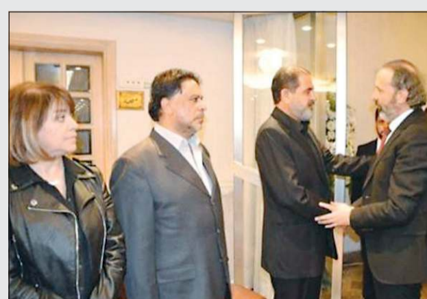
جانب من المعزين

رحمه الله كبير القلب ومتسامح زارني بمنزلي وانتهى الخلاف وكان معي غالب أعمال بكافة أجزاء باب الحارة حتى آخر جزء 12 وبروكار، كان غالباً رحمه الله، لكن الموت حق وهذه سنة الحياة. أما الفنان فادي صبيح فقال: لا يوجد شيء محزن في الحياة لأن الإنسان يعيش عمراً طويلاً ويرحل بلحظة زهير رمضان خسارة كبيرة للحياة الدرامية السورية وعزأؤنا الكبير لأسرته وزوجته ولسورية.