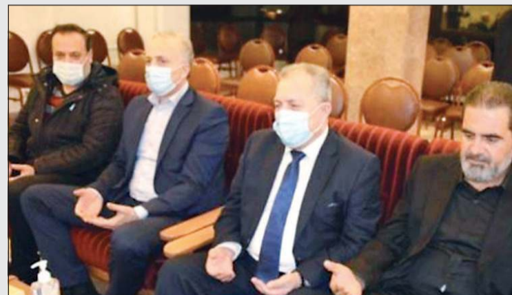
رئيس الحكومة السورية حسين عرنوس في مراسم العزاء