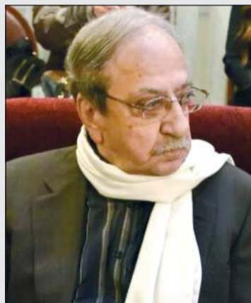
الفنانة فريدة دريد لحام