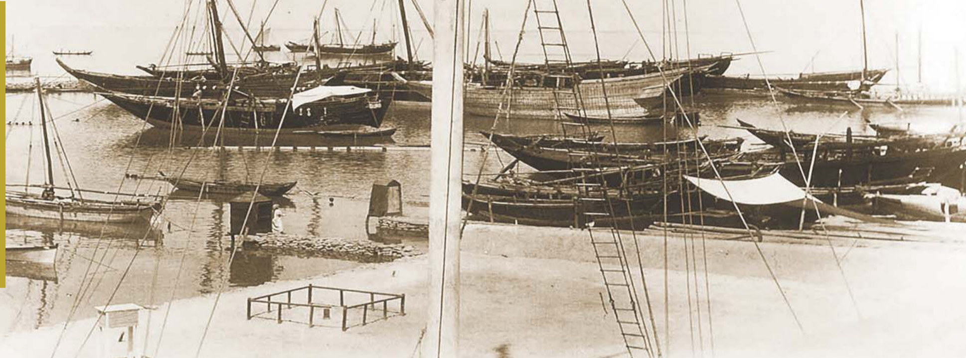
صورة قديمة تحاكي معركة الرقة التي وقعت في 12 أغسطس عام 1783 في جون الكويت