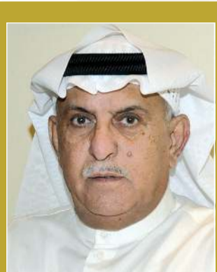
بقلم: عادل يوسف المرزوق