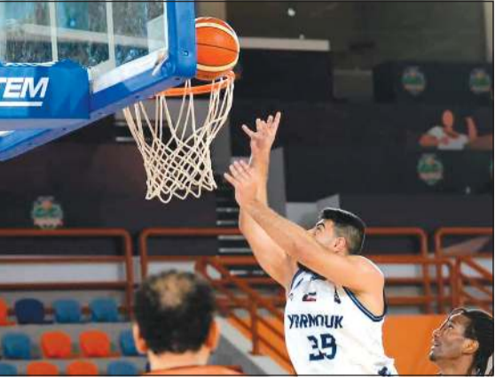
«سلة» اليرموك تسمى لمواصلة الفوز