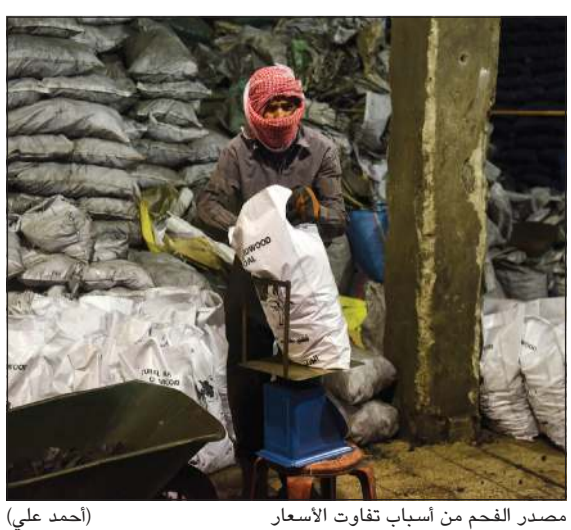
مصدر الفحم من أسباب تفاوت الأسعار (أحمد علي)