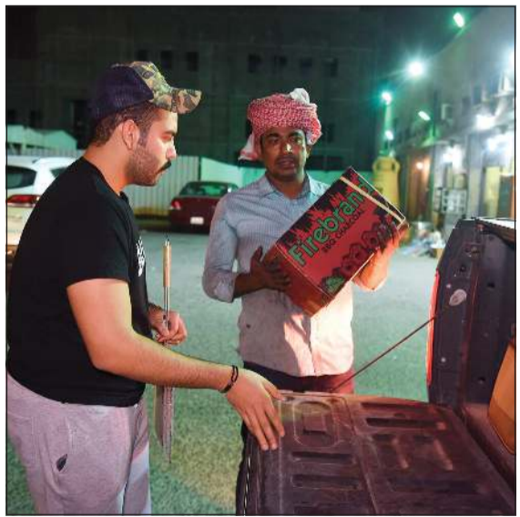
أحد الزبائن يحصل على بريده من الفحم