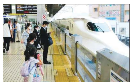
شبكة سكك الحديد في اليابان مثال يحتذى لفعاليتها ودقتها في المواعيد

طوكيو - (أ.ف.ب): يلاحق سائق قطار ياباني قضائيا الشركة التي يعمل لديها لحسمها 56 ينا (نصف دولار) من راتبه كعقاب له بسبب تأخر وصول قطار كان يقوده مدة دقيقة، على ما أعلنت الشركة الخميس. وتكرت صحيفة «يوموري شيمبون»، أن السائق تقدم بالشكوى في مطلع العام الحالي في حق شركة «ويست جابان ريلواي كومباني» (جي آر ويست)، إحدى أهم شركات سكك الحديد في اليابان، بعدما فرضت الأخيرة عليه غرامة بسبب ارتكابه خطأ مهينا تمثل في تأخر قطار كان يقوده مدة دقيقة واحدة في يونيو 2020. ويطلب المدعي بتعويض مقداره 2.2 مليون ين (19300 دولار) بسبب الأذى المعنوي الذي لحق به، وفق الصحيفة. وكان يجب على السائق إيصال قطار فارغ إلى خط جانبي في محطة أوكاياما للقطارات في غرب اليابان، لكنه أخطأ في تحديد الرصيف الصحيح. وأدى هذا الخطأ إلى تأخير تغيير السائق، ما انعكس تأخيرا في مغادرة القطار للمحطة ووصوله إلى وجهته بعد دقيقة من الوقت المحدد.