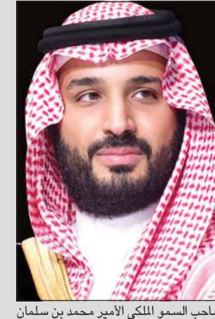
صاحب السمو الملكي الأمير محمد بن سلمان

جونسون يهاتف محمد بن سلمان ويرحب بالتزام السعودية بخفض الانبعاثات إلى الصفر بحلول 2060