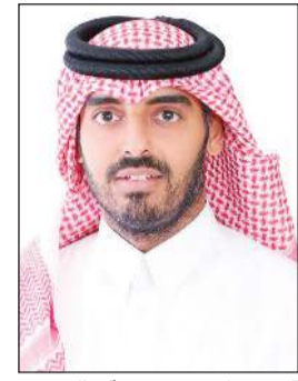
الشيخ ناصر بن حمد آل ثاني