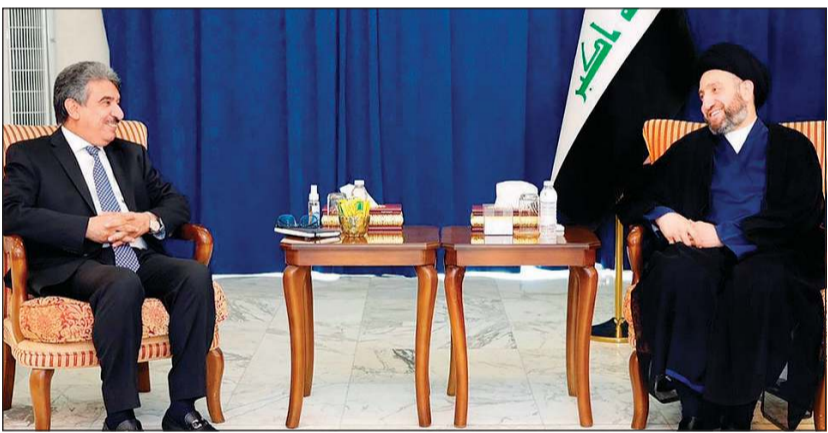
السيد عمار الحكيم مستقبلاً السفير سالم الزمان

منطلق المصالح المشتركة وثابت العراق ومصالحه ومصالح شعبه أولاً..