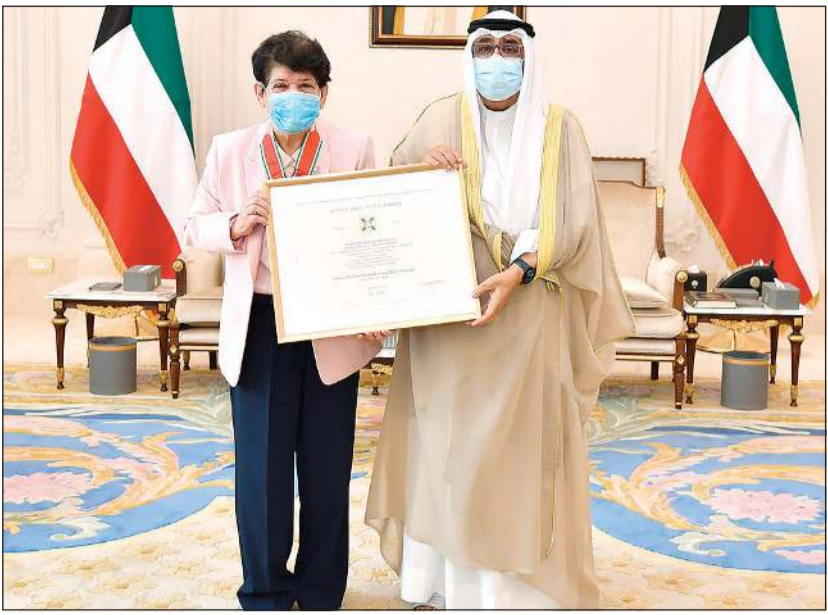
سمو ولي العهد الشيخ مشعل الأحمد مستقبلاً درشا الصباح

استقبل سمو ولي العهد الشيخ مشعل الأحمد بقصر بيان صباح أمس د.رشا المحمود الجابر الصباح بمناسبة حصولها على وسام نجمة إيطاليا برتبة ضابط والذي يعد أعلى وسام تمنحه الجمهورية الإيطالية لغير مواطنيها.