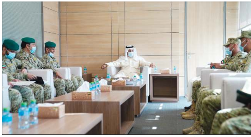
الفريق أول متقاعد الشيخ أحمد النواف خلال زيارته لقيادة المعاون للشؤون المالية وإدارة الموارد

قام نائب رئيس الحرس الوطني الفريق أول متقاعد الشيخ أحمد النواف بزيارة تفقدية لقيادة المعاون للشؤون المالية وإدارة الموارد التي التقى خلالها المعاون للشؤون المالية وإدارة الموارد اللواء رياض طواري وعددا من القادة والضباط للوقوف على آلية سير العمل، وذلك ضمن الزيارات الدورية التي يقوم بها لعدد من الوحدات. واستمع النواف إلى شرح من قادة وضباط الوحدات المعنية عن مهام وأجبات قيادة المعاون للشؤون المالية وإدارة الموارد وتنظيمه وأنشطته الرئيسية. وحث على التعاون مع الجهات الرقابية والالتزام بتعليماتها واتباع أقصى درجات الشفافية في جميع معاملات الحرس الوطني، والتقيد بالإجراءات القانونية المعمول بها في الحرس الوطني. وتبادل الحديث مع القادة والضباط، معربا عن ارتياحه لما شاهده ولمسه من جهود تهدف إلى الارتقاء بالكوادر البشرية والمنظومة الإدارية والمالية في الحرس الوطني.