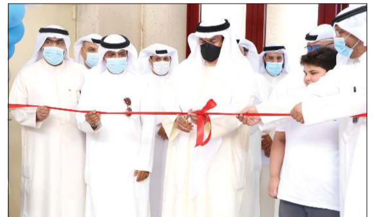
وزير التربية د.علي المصطفى يفتتح إحدى المدارس في الوفرة السكنية

الوزارة جميعا سعيدة بهذا الإنجاز والنجاح الذي تحقق في وقت قياسي. وذكر د. الجعوب أن دعم وزير التربية د.علي المصطفى ساهم في إسرار وتيرة تجهيز هذه المدارس وتوفير كافة متطلباتها واحتياجاتها، مثمنا كذلك الدور الكبير والجهود المصنفة والمميزة التي قام بها الوكلاء المساعدون وجميع المسؤولين والعاملين في منطقة الأحمدي التعليمية من أجل تحقيق هذا الإنجاز، مؤكدا حرص وزارة التربية بكل منتسبها على تسخير جميع الجهود والإمكانات اللازمة التي تلبي متطلبات المرحلة المقبلة، إضافة إلى توفير البيئة الآمنة للمتعلمين وأعضاء الهيئتين التعليمية والإدارية وكافة العاملين في المدارس، متمنيا عاما دراسيا ناجحا لطلبة والمعلمين