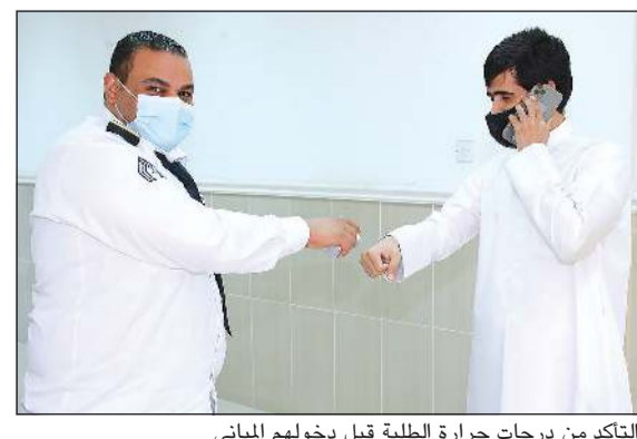
التأكد من درجات حرارة الطلبة قبل دخولهم المباني

في الكليات والمعاهد وفقا للاشتراطات الصحية التي أوصت عليها ضوابط العودة بالتطبيقي، حيث أهتم الطلبة