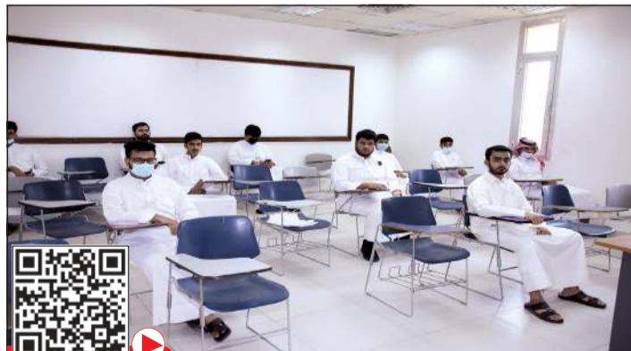
الحفاظ على التباعد بين الطلبة

وقالت في بيان لها امس انه مع بداية العام الجامعي الجديد مازالت جامعة الكويت تعاني من فراغ إداري هو الأكبر في تاريخها، حيث تتجاوز نسبة الفراغ في شاغلي المناصب الإدارية في الجامعة إلى 95٪ فمدير الجامعة وأغلب نوابه وأغلب عمداء الكليات ومساعدتهم ورؤساء الأقسام مكفون مؤقتا بسبب هذه المناصب، ومثل هذا الوضع يؤثر على تمكن الجامعة من القيام بدورها المنوط به كجامعة حكومية وطنية وحيدة في الكويت. وأضافت أن تأخير تعيين مدير للجامعة بالأصل هو السبب المباشر في تأخير تسكين المناصب الإدارية والأكاديمية الشاغرة، لاسيما بعد أن انتهت لجنة اختيار مدير الجامعة من أعمالها ورفعت تقريرها إلى وزير التعليم العالي. وقالت انها تواصلت مع د. محمد الفارس وزير التعليم العالي وبينت له ضرورة الاختيار وفقا للتشريعات المنظمة