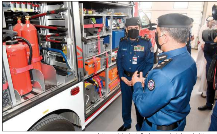
الفريق المكراد مطلعاً على تجهيزات أليات الإطفاء في المركز