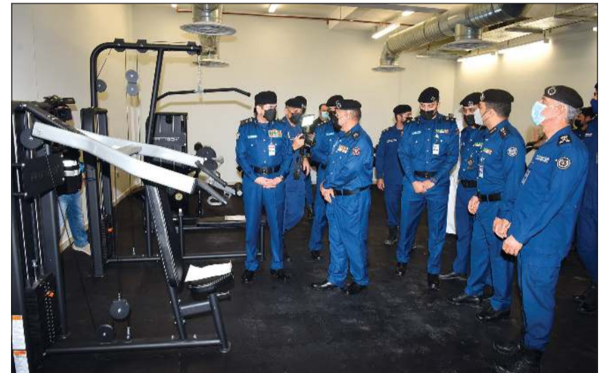
الفريق المكراد متفقدًا تجهيزات إحدى صالات الرياضة بالمركز