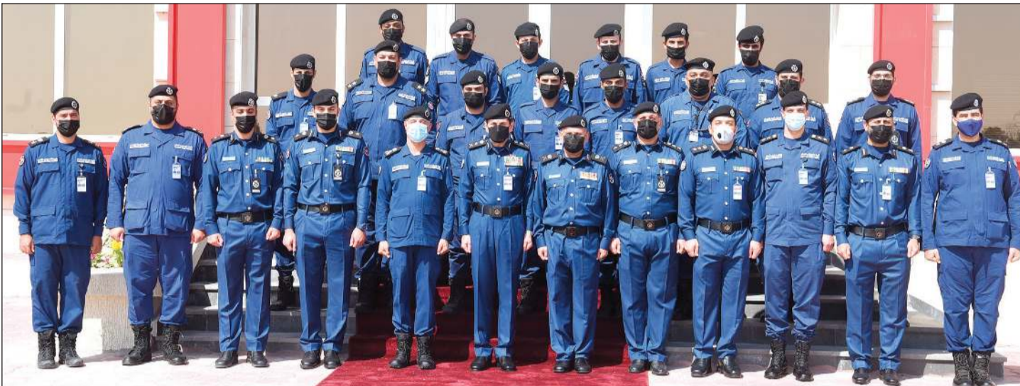
الفريق خالد المكراد واللواء جمال بدر ناصر يتوسطان عدداً من رجال الإطفاء في مركز الاستقلال في لقطة جماعية