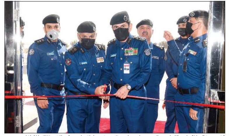
الفريق خالد المكراد واللواء جمال بدر ناصر لدى قص شريط افتتاح مركز الاستقلال للإطفاء

يغطي منطقة غرب عبدالله المبارك والمناطق المحيطة وهو رابع مركز إطفاء يفتتح بالمناطق الجديدة خلال العام الحالي