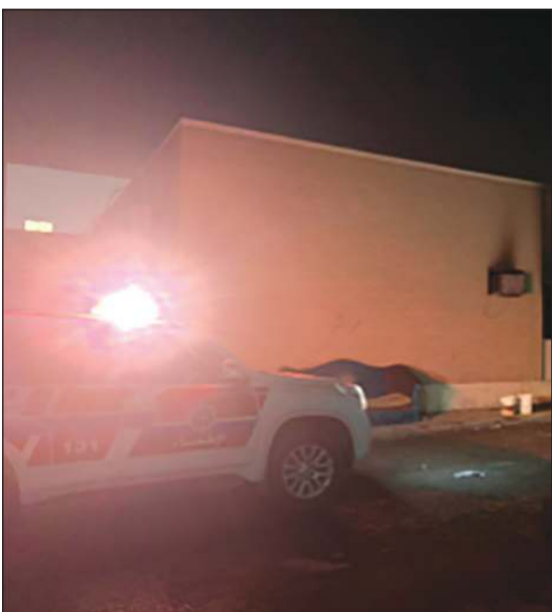
الغرفة التي اندلع بها الحريق

قالت إدارة العلاقات العامة والإعلام بقوة الإطفاء العام إن فرق الإطفاء تمكنت من السيطرة على حريق اندلع في سكن للعمال بمنطقة صناعية الجهراء. وأوضحت الإدارة أن بلاغاً ورد إلى غرفة العمليات يفيد باندلاع حريق غرفة في مبنى سكن للعمال تبلغ مساحته 400 متر مربع تقريباً، وعلى اثره تم توجيه فرق إطفاء مراكز الجهراء والجهراء الحرفي، وعند الوصول إلى موقع الحادث قامت الفرق بإخلاء سكن العمال وباشرت في مكافحة الحريق والحد من انتشاره دون وقوع أي إصابات بشرية.