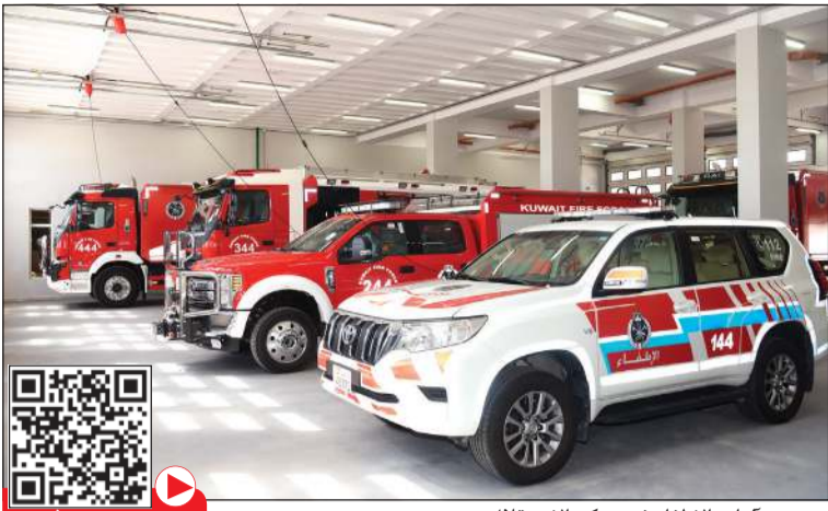
عدد من أليات الإطفاء في مركز الاستقلال