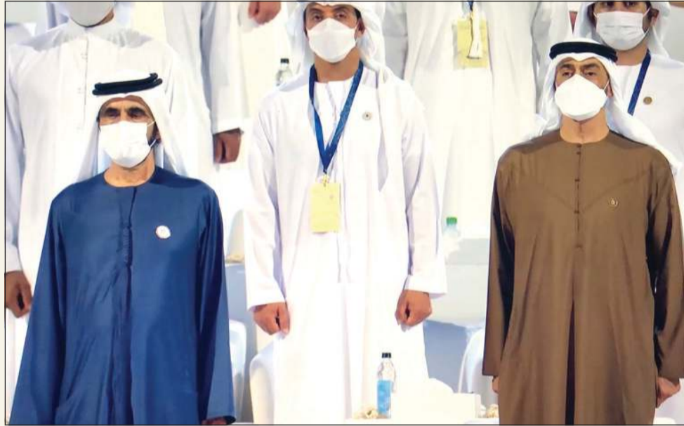
صاحب السمو الشيخ محمد بن راشد وصاحب السمو الشيخ محمد بن زايد خلال افتتاح معرض «إكسبو دبي 2020»

النهضة والتقدم والتفرغ للتنمية، وإنبات أن شعوب هذه المنطقة قادرة على صناعة المستقبل. وقال سموه إن الإمارات عملت على مدار عقد من الزمان لتجسيد وعدها بتنظيم إكسبو تاريخي وغير مسبوق، وما هي تقي بالوعد، للعالم بحدث سيسكن ذاكرة البشرية ليس من باب الإبهار فقط، بل أيضا لأنه وضع أجنحة عمل عالمية للبحث عن الحلول للتحديات التي تواجه عالم اليوم مثل قضايا البيئة والطاقة والتعليم والصحة والفقر، وتسخير العلوم والتكنولوجيا والابتكار للتأثير الإيجابي في حياة الشعوب وتغييرها للأفضل. تستعرض الدول في أجنحتها منتجات مختلفة ومتنوعة من روبوت صيني على شكل باندا إلى تابوت أثري فرعونى في الجناح المصري. وسيتم أيضا تنظيم «الأسبوع الموضوعات» خلال إكسبو، إذ سيتم التركيز على أمور مختلفة مثل المناخ والتنوع الحيوي والفضاء والتنمية الريفية والحضرية وغيرها. وتملك الصين أحد أكبر الأجنحة في المعرض بمساحة 4636 مترا مربعا. وأقيمت في الجناح الهولندي مزرعة هرمية الشكل تضم نباتات صالحة للأكل تروى بمياه المطر المولدة عبر الطاقة الشمسية، إذ سيركز إكسبو على حلول مستدامة في مجالات المياه والطاقة والغذاء، وتشارك أيضا إسرائيل في المعرض، في خطوة متقدمة جديدة في العلاقات بين الإمارات وإسرائيل اللتين وقعتا اتفاقا لتطبيع علاقاتهما قبل عام. وتحت شعار «نحو الغد» باللغتين العربية والعبرية، أقيم الجناح الإسرائيلي برعاية وإشراف وزارة الخارجية الإسرائيلية، وهو مفتوح، ووضعت له أرضية ترحي بوجودة كئيبان محلية وشاشات كبيرة. وداخل الجناح، ممرات مصنوعة من طوبق رقيقة من الخرسانة ومطلية بلون الرمال.