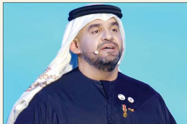
الفنان حسين الجسسي خلال مشاركته في حفل الافتتاح

ويتزامن إقامة المعرض خلال العام الحالي مع احتفالات دولة الإمارات بالعام الخمسين على تأسيسها، والتي بدأت فعليا في 6 أبريل الماضي وتستمر حتى 31 مارس 2022، حيث سيجعل الحدائق الكبيرة المترافقة من الإمارات قبلة إعلامية عالمية، ويتوقع أن يجذب المعرض العالمي ملايين السياح والمتخصصين في قطاعات مختلفة. وفي هذا السياق، عبر نائب رئيس الدولة رئيس مجلس الوزراء حاكم دبي صاحب السمو الشيخ محمد بن راشد، عن فخره واعتزازه باستقبال 192 دولة ليلتقي مخلوها المشاركين بمعرض «إكسبو دبي 2020»، على أرض التسامح وفي بلد اللامستحيل، مستثمرين هذا اللقاء