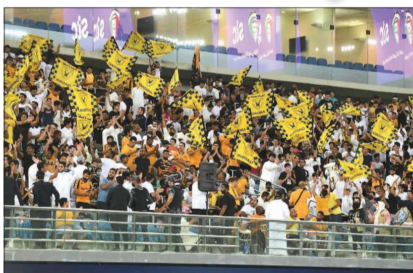
جماهير القادسية خرجت سعيدة بالفوز على الغربم التقليدي العربي