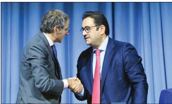
السفير صادق معرفي ورافائيل غروسي

كما أكد السفير معرفي استمرار الكويت في التعاون مع الوكالة الدولية للطاقة الذرية مشدداً على حرص الكويت على دعم أنشطة الوكالة وبرامجها ومبادراتها لاسيما ما يتعلق بتسخير الذرة من أجل السلام والتنمية. بدوره، أشاد المدير العام للوكالة الدولية للطاقة الذرية رافائيل غروسي برئاسة الكويت للدورة الـ 65 للمؤتمر العام للوكالة التي اختتمت أعمالها يوم الجمعة بعد نقاشات مستفيضة على امتداد 5 أيام.