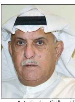
الخبير الفلكي عادل المرزوق

بمتوسط سرعة بين (12-45) كم/ساعة خلال اليومين أو الأيام الثلاثة المقبلة ولكن تستمر الرياح الشمالية الغربية في الهبوب على منطقة الخليج العربي حتى نهاية هذا الأسبوع، الأمر الذي سوف يؤدي إلى انخفاض نسبة الرطوبة النسبية فتكون في منطقة شمال الخليج العربي خلال هذه الفترة بين (10-35٪)، وهذه الرياح الشمالية النشطة نوعاً ما سوف تثير الغبار والأترية في المناطق المكشوفة ولكن من المتوقع أن تخف سرعة الرياح من بعد الأربعاء حيث تكون سرعتها بين (8-15) كم/س وحتى الأحد ثم يتوقع أن تتحول الرياح إلى جنوبية