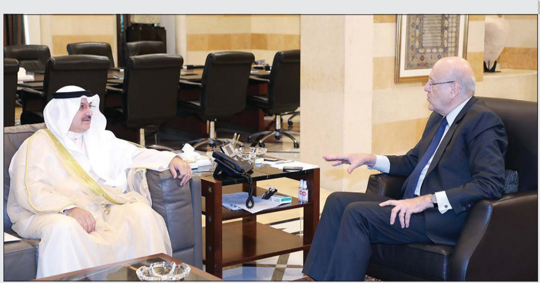
رئيس مجلس الوزراء نجيب ميقاتي مستقبلا سفير الكويت عبدالعال القناعي (محمود الطويل)

يبدشن رئيس الحكومة اللبنانية نجيب ميقاتي، اليوم الخميس، زيارته الخارجية من باريس، عراية حكومته بلا منازع، وغدا الجمعة سيكون لقاؤه الأول، مع الرئيس الفرنسي إيمانويل ماكرون، الذي يريد من نجاحه في تشكيل حكومة في لبنان، تعويضا عن الخسارات التي مني بها في ملفات دولية أخرى، كاستراليا وسويسرا، بسبب شروده عن المسار الأمريكي في الشرق الأوسط، كما يبدو. واستيق ميقاتي رحلة باريس، باستقباله سفيرة الولايات المتحدة الأميركية دوروثي شيا، العائدة من رحلة إلى بلدها، كما استقبل قائد الجيش العماد جوزيف عون والمجلس العسكري مهنيين وقال للعماد عون: لقد أثبتت قيادة الجيش أنها عصيبة على كل الخلافات والتداعيات السياسية. والرئيس ميقاتي والشهيد بتدوير الزوايا الحادة، معروف عنه الإسكاف بالعصا من الوسط أيضا.