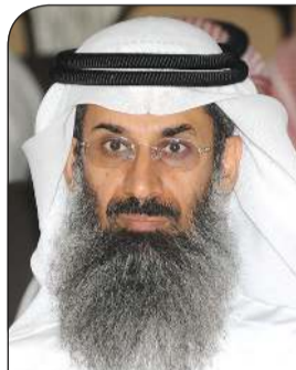
الشيخ د. أحمد الكوس

قال الله عز وجل (يا أيها الذين آمنوا إن جاءكم فاسق بنبأ فتبينوا أن تصيبوا قوما بجهالة فتصبحوا على ما فعلتم نادمين). امر صريح بالتحقق من صدق الكلام عند سماعه والتحقق من صدق فأنه حتى لا يؤدي التسرع الى الندم بعد فوات الأوان. وللأسف أصبحت وسائل التواصل الاجتماعي نبت الشائعات. وخاصة أثناء تفشي فيروس كورونا. وقام البعض بنشر الذعر والخوف. وبعد انحسار كورونا أصبح المروجون للشائعات يبنون الخوف واللعن من أضرار التطعيم وأتاره السببية على الجسم. حول نشر الشائعات دون التأكد منها. تعرف على رأي علماء الشرع والأخلاق: