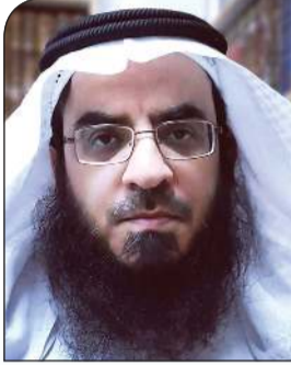
الشيخ سعد الشمري