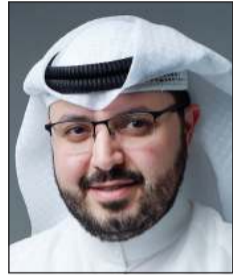
د. عبد العزيز الصقبي

أعرب النائب د.عبد العزيز الصقبي عن استغرابه لما يتردد عن عزم الصندوق الكويتي للتنمية وقف تجديد قرض بنك الائتمان بقيمة 500 مليون دينار والذي حصل عليه البنك قبل 14 سنة، وأوضح الصقبي أنه تقدم امس بسؤال برلماني للوقوف على صحة هذه المعلومة (الخطيرة)، كما سيجتمع خلال الأيام المقبلة مع المسؤولين عن هذا الملف من أجل حسم هذا الموضوع. وبين الصقبي أن هذا التوجه سيؤدي إلى تعطيل الدفعات المالية لأكثر من 7142 أسرة من أصل 12 ألف أسرة، مؤكداً أن هذا الأمر غير مقبول ولا يمكن السماح به.