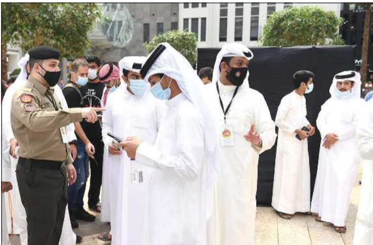
إقبال من الشباب على التعرف على القطاعات العسكرية من خلال بوث الجيش الكويتي في الأفتنيوز