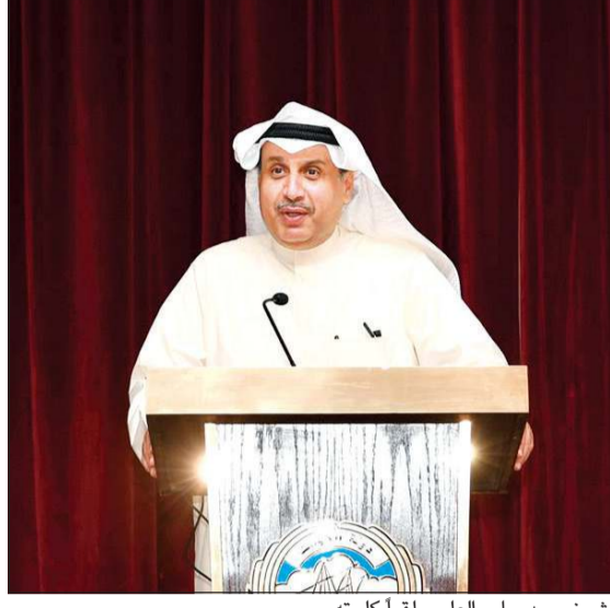
الشيخ حمد جابر العلي ملقياً كلمته