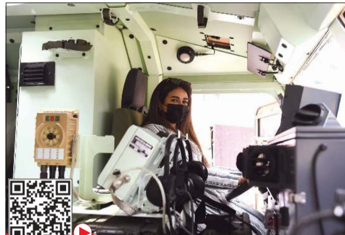
هل نرى العنصر النسائي في الجيش قريباً؟ (محمد هاشم)