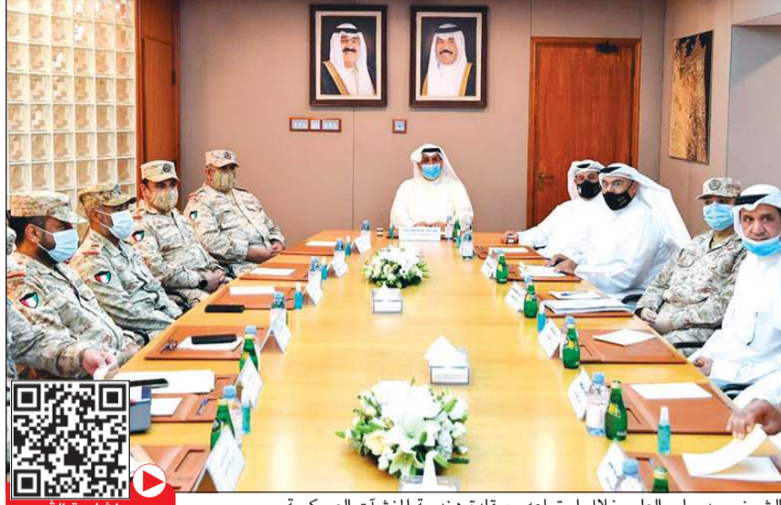
الشيخ حمد جابر العلي خلال اجتماعه مع قادة هندسة المنشآت العسكرية