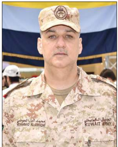
مدير مديرية التوجيه المعنوي العقيد الركن محمد أبل العوضي