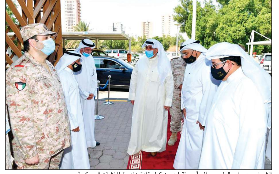
الشيخ حمد جابر العلي مصافحاً مستقبليه من كبار قادة هندسة المنشآت العسكرية

والإسهام في تحقيق تقدمه وازدهاره ورفعته في ظل القيادة الحكيمة لصاحب السمو الأمير القائد الأعلى للقوات المسلحة وسمو ولي عهده الأمين، وسمو رئيس مجلس الوزراء، حفظهم الله ورعاهم وسدد على طريق الخير خطاهم.