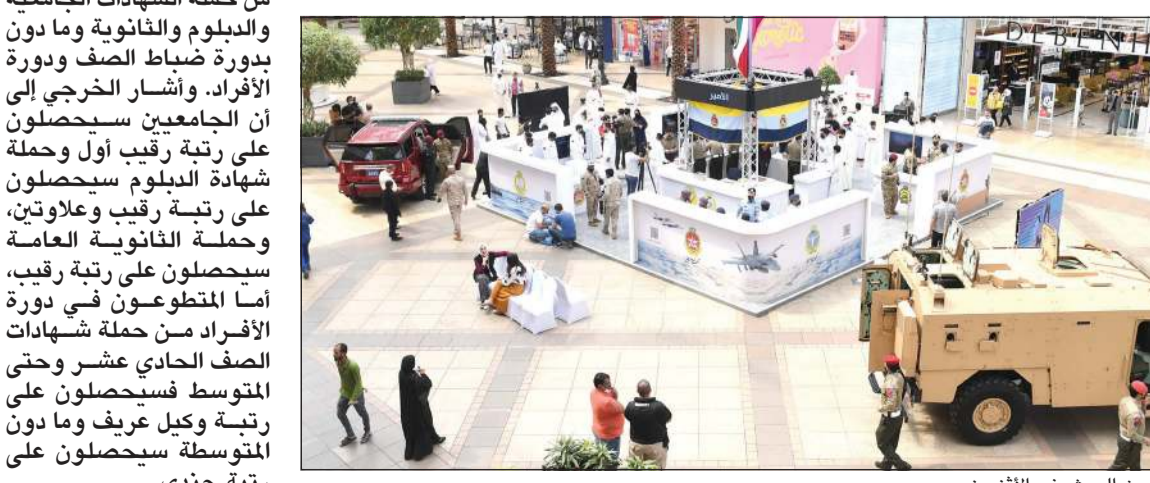
بوث الجيش في الأفتنيوز

هميش انطلاق حملة «كن منهم»، والتي أقيمت صباح أمس في مجمع الأفتنيوز لإطلاع الشباب الكويتي على دور ومهام القطاعات العسكرية أن الحملة تهدف إلى جذب الشباب الكويتي المتطوع في خدمة العسكرية للزود والدفاع عن الوطن على الانخراط في السلك العسكري. وأضاف اللواء الكندري أن الكثير من الشباب الكويتيين لديهم الرغبة في الالتحاق بالسلك العسكري، ولكن توجد الرهبة لديهم، ونحن من خلال هذه الحملة قمنا باختيار المكان المناسب حتى يطلعوا على المهام والواجبات عن قرب، مضيفاً أن هناك توجيهات من القيادة العسكرية بتترك حرية اختيار المتطوع للسلاح أو القوة التي يريد العمل بها.