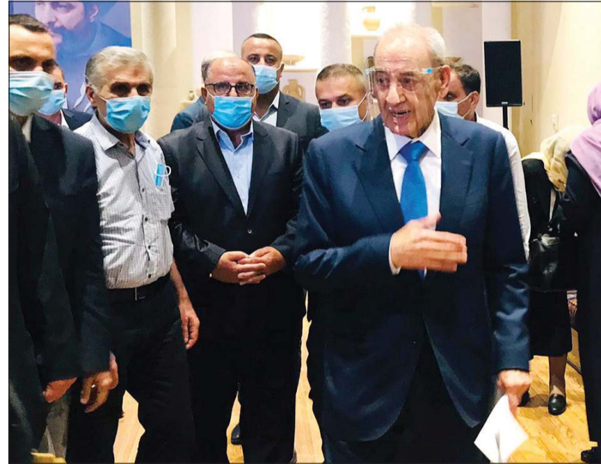
رئيس مجلس النواب نبيه بري بعد إلقاء كلمته بمناسبة الذكرى 43 لتعيين الإمام موسى الصدر (محمود الطويل)

وقد دعا رئيس مجلس النواب نبيه بري «إلى تنحية كل الخلافات وتشكيل حكومة خلال هذا الأسبوع»، وقال في كلمة له بمناسبة الذكرى 43 لتعيين الإمام موسى الصدر مؤسس حركة أمل ورفيقه «لا زلنا علنا وفي الخفاء نقدم المبادرات التي لا تهدف إلى التصويب على أحد والتاريخ يشهد على التضحيات التي قدمتها ولن نكون شهود زور بعد الآن»، وحث من «محاولة موصوفة لاخطف لبنان وإسقاطه من الداخل». وتطرق بري إلى التحقيقات حول انتخاب مرفأ بيروت وقال «مجلس النواب ليس «مجلس نخبات» ولا يجوز التجني المطلوب من المحقق العدلي تطبيق القانون لا أن يقفز فوقه»، وتوجه إلى قاضي التحقيق طارق بطار قائلا: «اسمع صوت الحقيقة لا صوت من يهمس لك».