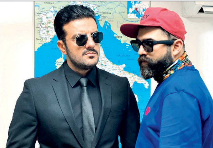
المخرج حسين دشتي والفنان طلال مارديني