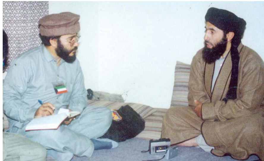
القائد قلب الدين حكمتيار في حوار مع الزميل يوسف عبدالرحمن في عام 1986

كانت ولم تزل الاستخبارات العسكرية تلعب دورا بارزا وكبيراً في الملف الأفغاني ولم يعد ذلك خافيا بعد أن ساهمت إلى حد كبير في هزيمة الجيش الأحمر السوفييتي، وهي التي أمدت المجاهدين (قادة الشمال) بالأسلحة وهي التي أيضا سلحت طالبان. فعلى سبيل المثال يعتبر الشيخ إسماعيل خان أحد كبار المجاهدين الذين تصدروا في مواجهة الاتحاد السوفييتي يوم كان قائدا لأمعا في غرب أفغانستان، وهو الذي باع مدينة هرات القريبة من الحدود الإيرانية للمخابرات الباكستانية في صفقة غير مسبوقة تاريخيا، ما عجل بسقوطها في أيدي طالبان في سبتمبر 1995، وهو الذي استولى على أموال حزبه (الجمعية الإسلامية) الذي كان يتقاسم السلطة والنفوذ في كابول حينئذ بعد تامين مستقلة عائلته في فرنسا ثم ليهرب بدوره إلى مدينة مشهد في إيران!