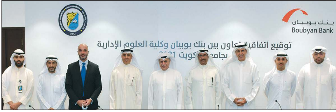
القياديون من بنك بوبيان وكلية العلوم الإدارية في صورة تذكارية

الماجذ: حريصون على التعاون مع أبرز المؤسسات التعليمية لمنح الخريجين فرصاً مميزة زينل: الاتفاقية مع البنك تمنح خريجي الكلية فرصاً للتطوير واكتساب خبرات عملية