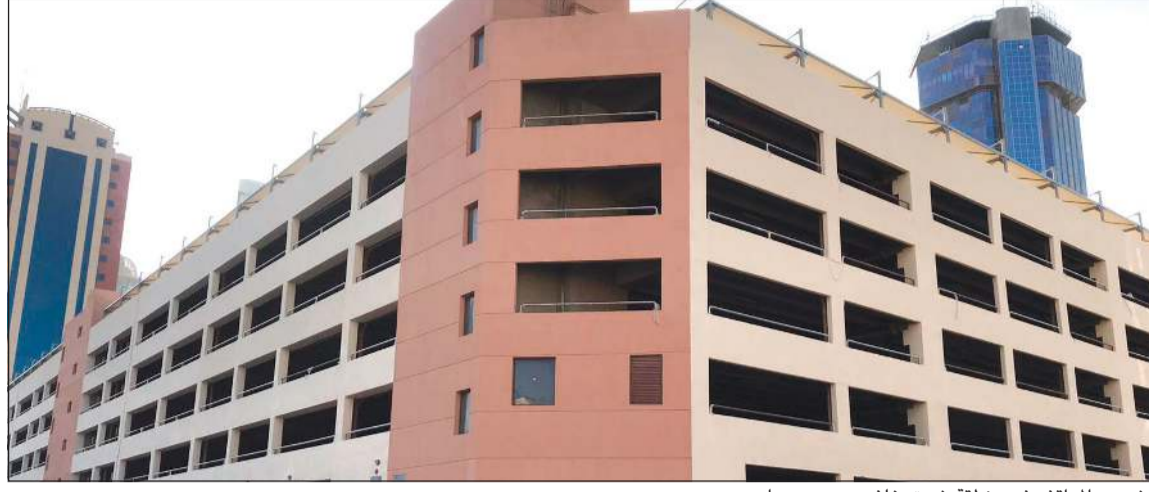
مشروع المواقف في منطقة شرق خلف مجمع دسمان