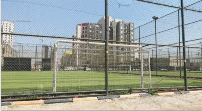
أحد الملاعب المخالفة

أوضحت إدارة العلاقات العامة في البلدية، أن الفريق الرقابي التابع لفرع بلدية محافظة مبارك الكبير قام بالكشف ميدانيا على موقع ملاعب كرة القدم بمنطقة صباح السالم، وتبين أنها مقامة على ساحات أملاك خاصة لأحد المستثمرين. وأكدت خلال ردها بشأن الفيديو المتداول في بعض مواقع التواصل الاجتماعي حول إقامة 4 ملاعب كرة قدم دون ترخيص، أنه تم عمل تحرير محضر مخالفة بناء بعد إنذاره بالإزالة وعدم استجابته، وأضاف أن المخالفة هي استغلال العقار في غير الغرض المخصص له حسب نظم وقوانين البناء وأنه تمت إحالة الموضوع إلى الجهات المعنية لاتخاذ الإجراءات القانونية.