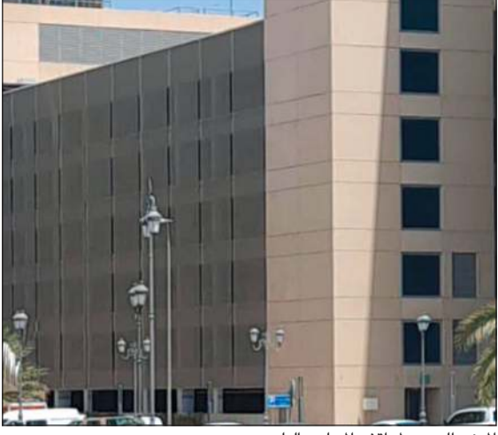
المبنى الجديد لمواقف المجلس البلدي