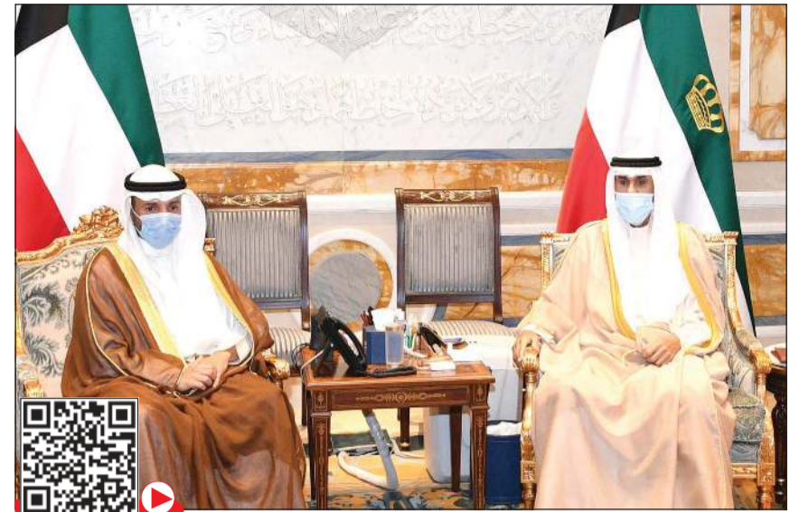
صاحب السمو خلال استقباله رئيس مجلس الأمة مرزوق الغانم