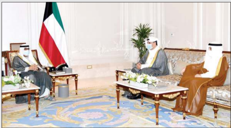
سمو ولي العهد الشيخ مشعل الأحمد مستقبلاً الشيخ حمد جابر العلي والشيخ د. أحمد ناصر المحمد

استقبل سمو ولي العهد الشيخ مشعل الأحمد بقصر بيان صباح أمس سمو ولي العهد الشيخ مشعل الأحمد. كما استقبل سمو ولي العهد نائب رئيس مجلس الوزراء وزير الدفاع الشيخ صباح الخالد مستقبلاً الشيخ حمد جابر العلي والشيخ د. أحمد ناصر المحمد. كما استقبل سمو ولي العهد نائب رئيس مجلس الوزراء وزير الدفاع الشيخ صباح الخالد مستقبلاً الشيخ حمد جابر العلي والشيخ د. أحمد ناصر المحمد.