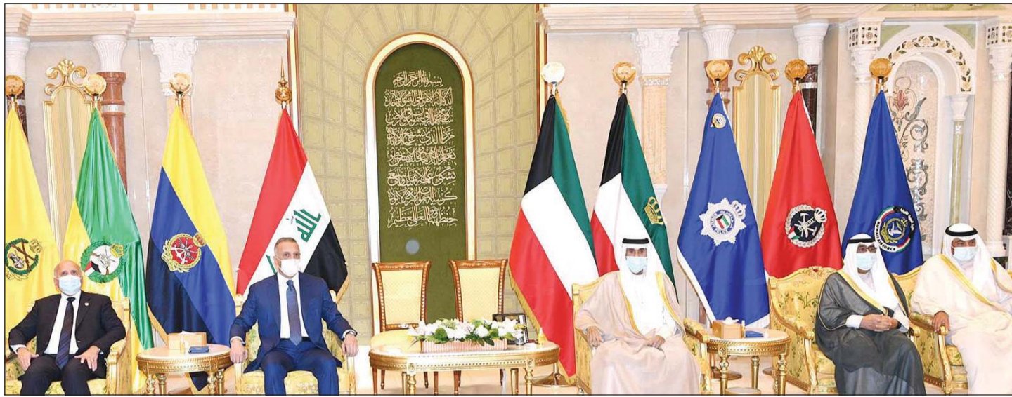
صاحب السمو الأمير الشيخ نواف الأحمد خلال استقباله رئيس الوزراء العراقي مصطفى الكاظمي بحضور سمو ولي العهد الشيخ مشعل الأحمد وسمو الشيخ صباح الخالد