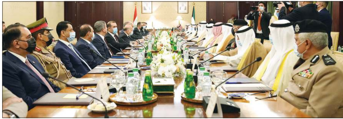
سمو الشيخ صباح الخالد خلال مباحثاته الرسمية مع رئيس الوزراء العراقي

ان العراق المستقر لشؤون الاتصالات الاقتصادية مصلحة كويتية. الى ذلك، عقد سمو رئيس مجلس الوزراء الشيخ صباح الخالد جلسة مباحثات رسمية مع دولة رئيس مجلس الوزراء جمهورية العراق الشقيق مصطفى الكاظمي. وجرى خلال جلسة المباحثات التي سادتها أجواء ودية استعراض العلاقات الثنائية الوطيدة بين البلدين وسبل تعزيزها في شتى المجالات بما يخدم مصالح البلدين والشعبين الشقيقين. كما بحث الجانبان آخر المستجدات والقضايا الإقليمية المتبادلة والدولية ذات الاهتمام المشترك ومواقف البلدين تجاهها. حضر المباحثات عن الجانب الكويتي وزير النفط والفكرات والمهام والقطاعات الاقتصادية، ووزير الخارجية الفارس، ووزير الدولة لشؤون مجلس الوزراء الشيخ د. أحمد ناصر المحمد، ووزير الأشغال العامة