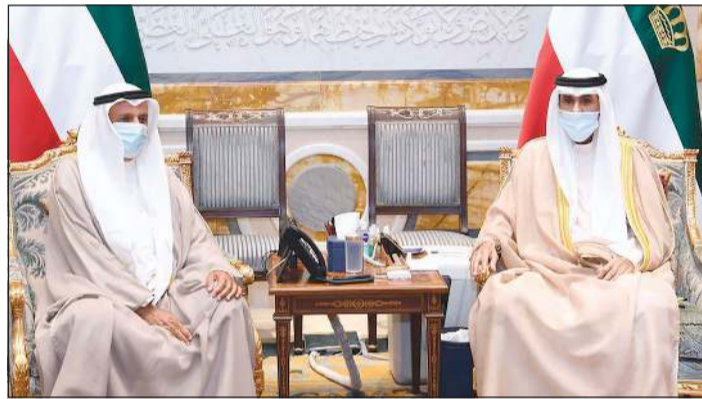
صاحب السمو خلال استقباله عبدالله الرومي

استقبل سمو ولي العهد الشيخ مشعل الأحمد بقصر بيان صباح أمس سمو ولي العهد الشيخ مشعل الأحمد. كما استقبل سمو ولي العهد نائب رئيس مجلس الوزراء وزير الدفاع الشيخ صباح الخالد مستقبلاً الشيخ حمد جابر العلي والشيخ د. أحمد ناصر المحمد. كما استقبل سمو ولي العهد نائب رئيس مجلس الوزراء وزير الدفاع الشيخ صباح الخالد مستقبلاً الشيخ حمد جابر العلي والشيخ د. أحمد ناصر المحمد.