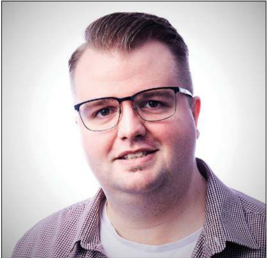
د. روبي لوف

مهمة د. روبي لوف، في جامعة أستون البريطانية، هي تحليل كلمات الغضب التي يستخدمها البريطانيون، وذلك لأنه متخصص في دراسات الاتصال وتحليل الخطاب. فهو متخصص في دراسة الأحاديث والحوارات التي تتم بين الناس العاديين، ثم تحديد وتيرة استخدام كلمات الغضب فيها، والمقياس هو: كم مرة تأتي كلمات الغضب داخل كل مليون كلمة. في أحدث دراسة نشرت له - وفق صحيفة التليغراف البريطانية - اهتم بتحديد ملامح استخدام كلمات الغضب، خلال فترة العشرين عاما الواقعة بين سنة 1994 وسنة 2014. ويقول د. لوف انه لاحظ ان استخدام كلمات الغضب صار أقل خلال فترة العشرين عاما الماضية إجمالا، لكنه يؤكد ان كل فئة عمرية تستخدم كلمات الغضب بشكل مختلف. فالشباب والمراهقون، مثلا يستخدمون كلمات الغضب في أحيادهم بشكل أكثر تواترا من الكبار والشيوخ. ويضيف د. لوف: «كلما تقدمت في العمر، بعد سن الثلاثين، قلت وتيرة تكرار كلمات الغضب في حديثك».