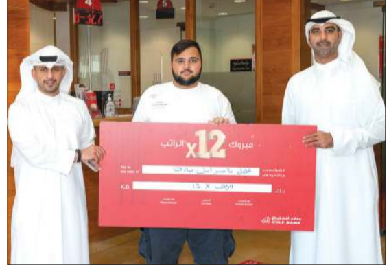
فريق بنك الخليج مع الفائز