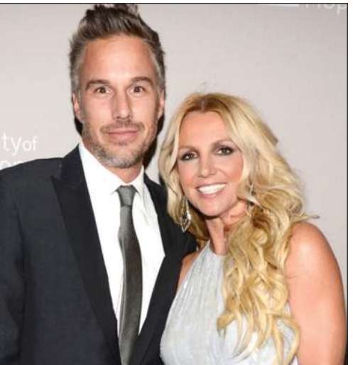
بريتني سبيرز مع جيسون تراويك عام 2011