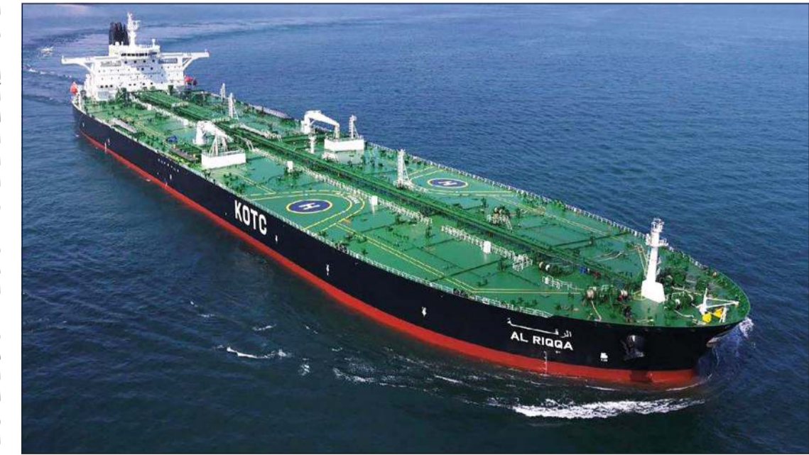
ناقلة النفط الخام «الرقعة» إحدى ناقلات النفط الكويتية التي انضمت للخدمة في 2011

المنظمة الخاصة بشركة ناقلات النفط الكويتية. وتتنظر «مؤسسة البترول» إلى شركة ناقلات النفط الكويتية باعتبارها غطاء استراتيجي وذلك لنقل النفط الخام الكويتي والمنتجات البترولية الكويتية والغاز المسال في حالة الطوارئ والأزمات لخارج المنطقة (مضيق هرمز وذلك بعد تلبية الاحتياجات المحلية بما يشمل احتياجات وزارة الكهرباء والماء). وفي حالة الطوارئ والأزمات وهو الوضع الذي يجعل ملاك الناقلات يرفضون الدخول إلى منطقة الخليج العربي نتيجة تعرض الكويت والدول المجاورة لها في منطقة الخليج لخطر مباشر أو غير مباشر، أي أن الوضع متوتر في منطقة الخليج العربي، وبالتالي تصبح ناقلات شركة الناقلات الكويتية هي البديل الوحيد لنقل الصادرات الكويتية خارج المنطقة. ويبلغ كلفة إنشاء الناقلات الواحدة للنفط الخام نحو 49,8 مليون دينار، فيما يبلغ كلفة بناء ناقلة غاز مسال نحو 23 مليون دينار أما ناقلة المنتجات البترولية فبلغ أدناها 5 ملايين دينار وأقصاها 22 مليون دينار حسب الحجم والسعة.