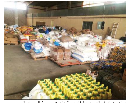
أنواع من المواد التموينية المدعومة تفترش ساحة الجمرک البري

تهريب البضائع المدعومة، مشددة على أنه سيعرض نفسه للمساءلة القانونية واتخاذ الإجراءات الجمركية بحق.