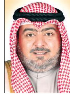
الشيخ تامر العلي

البدلات والمكافآت الخاصة بالجهات العسكرية والأمنية الـ 4 وضعت بدلاته من قبل كل وكيل مساعد على حدة وهو ما أحدث التفاوت والذي وجب إعادة النظر فيه وتحقيق المساواة على الأقل بالنسبة للعسكريين ممن تتشابه طبيعة عملهم مع بعضهم البعض، متسائلاً: ما الفرق بين دوريات الأمن العام فالأول يتحصل بموجب القرار على مبلغ 440 ديناراً بينما يتحصل زميله على 330 ديناراً، لافتاً إلى أن العاملين بالمخافر موكل إليهم مهام كبيرة لهم إلا أن مكافآته أقل