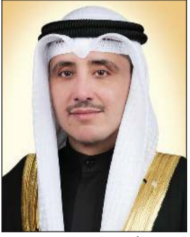
الشيخ د.أحمد ناصر الحمد

تلقي وزير الخارجية ووزير الدولة لشؤون مجلس الوزراء الشيخ د.أحمد ناصر الحمد اتصالاً هاتفياً من وزير خارجية الولايات المتحدة الأميركية الصديقة انتوني بليكن، حيث تمت مناقشة آخر المستجدات على الساحة الأفغانية. وقد عبر الوزير الأميركي خلال الاتصال، عن عميق التقدير والامتنان للجهود التي تقدمها الكويت لتأمين العبور الآمن وتيسير إجلاء الدبلوماسيين والرعايا الأميركيين والدول الأخرى من أفغانستان وتأمين وصولهم إلى بلدانهم سالمين.