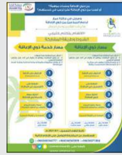
تصميم جائزة عمار

وقد تم تشكيل لجنة تحكيم من مشاهير الخليج العربي من فنانين وإعلاميين وأصحاب التخصص لتقييم المواهب وفرزهم وتأهيلهم للمراحل النهائية. وتعتمد الجائزة على مسارين، وهما مسار الموهوبين من ذوي الإعاقة ومسار الأصحاء ممن لديهم أفكار تخدم ذوي الإعاقة، حيث خصصت 3 جوائز قدرها 150 ألف ريال لأصحاب المراكز الثلاثة الأولى من ذوي الإعاقة فيما خصصت جائزة قدرها 25 ألف ريال للفائز من مسار غير