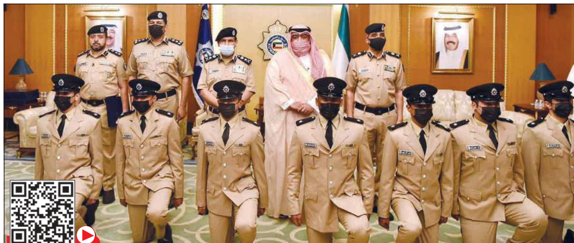
وزير الداخلية الشيخ ثامر العلي ووكيل الوزارة الفريق عصام الفهيم يتوسطان قيادات الأكاديمية والخريجين الجدد

وقال د.السند لـ «كونا» إنه تم تسجيل حالتى وفاة جراء تداعيات الإصابة ليصل إجمالي عدد حالات الوفاة إلى 2395.