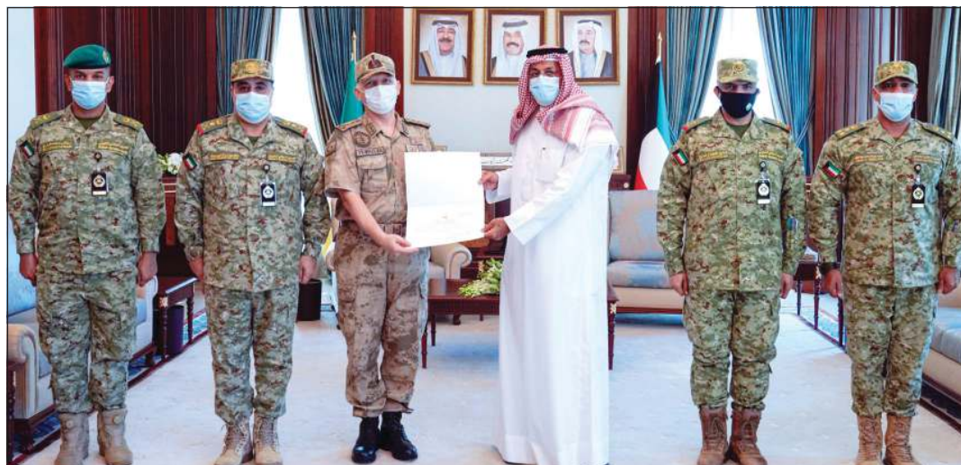
الفريق أول متقاعد الشيخ أحمد النواف والفريق الركن م.هاشم الرفاعي خلال استقبال العقيد ناجي يلمزلا

استقبل نائب رئيس الحرس الوطني الفريق أول متقاعد الشيخ أحمد النواف في ديوانه بالرئاسة العامة للحرس الوطني، بحضور وكيل الحرس الوطني الفريق الركن م.هاشم الرفاعي وكبار القادة العقيد ناجي يلمزلا ضابط ارتباط قوات الجندرها التركية، وذلك بمناسبة انتهاء فترة عمله في الحرس الوطني. ونقل الحرس الوطني في بيان صحافي إشادة الشيخ أحمد النواف بجهود العقيد ناجي يلمزلا وحرصه على ترسيخ التعاون بين الحرس الوطني وقوات الجندرها التركية لتحقيق بنود اتفاقية التعاون المبرمة بين الجانبين خاصة في مجال التدريب والتعاون الأمني والعسكري وبما قدمه من خبرات ساهمت في تطوير العمل بالحرس الوطني.