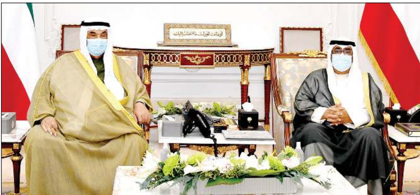
سمو ولي العهد الشيخ مشعل الأحمد مستقبلا سمو الشيخ ناصر المحمد

كما بعث سمو رئيس مجلس الوزراء الشيخ صباح الخالد ببرقية تهنئة مماثلة.