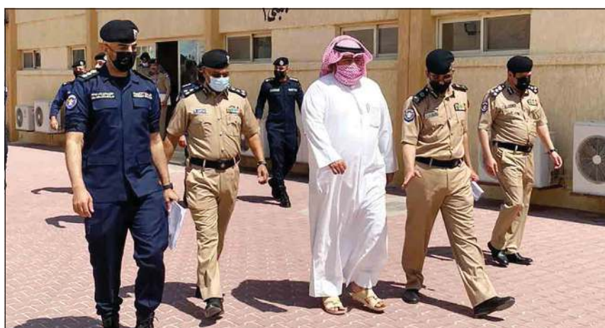
الشيخ ثامر العلي خلال جولته في معهد تدريب ضباط الصف والأفراد

كما استمع إلى شرح عن مدى جاهزية المعهد ووجه بسرعة صيانة جميع مرافق المعهد وإنهاء جميع التجهيزات الفنية والتقنية والتعليمية اللازمة لاستقبال الدفعة الجديدة من الطلبة وتوفير لهم بيئة علمية سليمة لتخريج كوكبة من رجال الشرطة قادرين على حماية أمن الوطن.