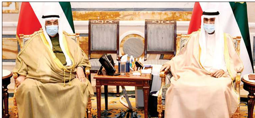
صاحب السمو الأمير الشيخ نواف الأحمد مستقبلا سمو الشيخ ناصر المحمد

كما بعث سمو رئيس مجلس الوزراء الشيخ صباح الخالد ببرقية تهنئة مماثلة.