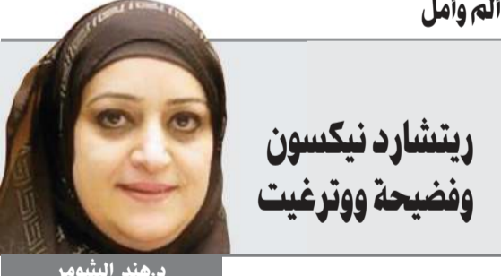
ريتشارد نيكسون وفضيحة ووترغيت

ألم وأمل كنت أتابع أحد الأفلام الأجنبية عن قصة الرئيس الأميركي ريتشارد نيكسون والذي قرر التجسس على مكاتب الحزب الديموقراطي المنافس له في مبنى ووترغيت عندما شعر أنه من الصعب التحديد له للرئاسة. وتفجرت أزمة سياسية هائلة حينذاك وتوجهت أصابع الاتهام بعد التحقيقات إلى الرئيس نيكسون، فقام بتقديم استقالته حتى لا تتم إدانته وإقالته. ويحكى الفيلم عن الإعلامي المتميز الذي سعى لإجراء مقابلة مع الرئيس المستقيل ليحصل على اعترافه لاحقاً، وهذا الاعتراف الذي عجزت عنه المحاكم للحصول عليه. إن هذا الإعلام هو أحد الأمثلة التي تبين كيف أن الإعلام يعتبر شريكاً رئيسياً في التحقيقات واتخاذ القرارات والتنمية وأنه وسيلة لنقل الرسائل ذات المحتوى الدقيق والواضح وبالتفاعل مع