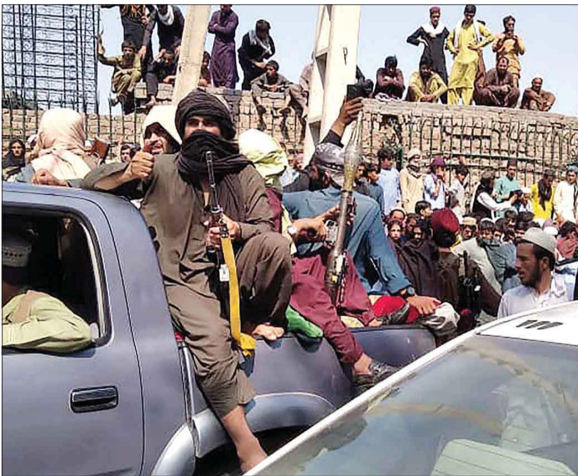
مسلمو طالبان في أحياء جلال آباد التي سيطرت عليها قبل دخولها كابول أمس

إسطنبول - أ.ف.ب: أعلن الرئيس التركي رجب طيب أردوغان أن بلاده ستعمل مع باكستان لإرساء الاستقرار في أفغانستان بهدف منع تدفق اللاجئين من الدولة التي تشهد نزاعا. وقال أردوغان: «تركيا تواجه موجة هجرة متزايدة من الأفغان الذين يعبرون إيران. سنواصل بذل الجهود للسماح بعودة الاستقرار إلى المنطقة، بدءا من أفغانستان». وأضاف: «لذلك، علينا مواصلة وتعزيز تعاوننا مع باكستان» الدولة المجاورة لأفغانستان والجهة الفاعلة الرئيسية في هذا البلد. وتابع: «نحن مصممون على تعبئة الوسائل المتاحة كافة لدينا للتوصل إلى ذلك». وكان أردوغان الذي لم يعط مزيدا من التفاصيل، يتحدث في إسطنبول بحضور نظيره الباكستاني عارف علوي أثناء حفل تدشين سفينة عسكرية بنتها تركيا لباكستان. واقترحت تركيا التي تنشر مئات العسكريين في أفغانستان، الشهر الماضي على الولايات المتحدة التكفل بأمن مطار كابول الدولي بعد انسحاب القوات الغربية نهاية أغسطس، شرط الحصول على دعم لوجستي ومالي. وتواجه تركيا منذ أشهر تدفقا للمهاجرين الأفغان الذي يدخلون أراضيها عبر حدودها مع إيران في الشرق. وتصدر هذا الملف في الأسابيع الأخيرة الجدالات السياسية في تركيا، إذ إن المعارضة تمارس ضغوطا على الحكومة لاتخاذ تدابير صارمة لمنع هذا التدفق. في هذا الإطار، سرعت أنقرة في الأيام الأخيرة تشييد جدار حدودي مع إيران. وقال أردوغان أمس «مع هذا الجدار، سنوقف بشكل نهائي عمليات العبور».